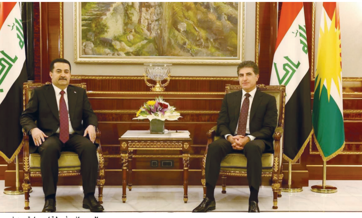
السوداني في لقاء سابق مع نجرفان بارزاني

قانوني دستوري والثاني داخلي في إقليم كردستان، وتابع بروراي. أن المشكلة قد تفاقت بعد سلسلة قرارات المحكمة الاتحادية العليا وكان آخرها بأنها حلت محل السلطة التشريعية في تعديل قانون انتخابات برلمان الاقليم، وأشار إلى أن ما جرى بشأن الانتخابات ليس بعيدا عن مجمل الخلافات بين الحكومة الاقادية واقليم كردستان.