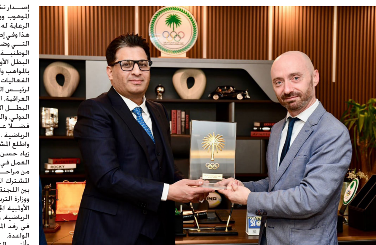
مفتن ومستشار النشاط الثقافي في السفارة الفرنسية