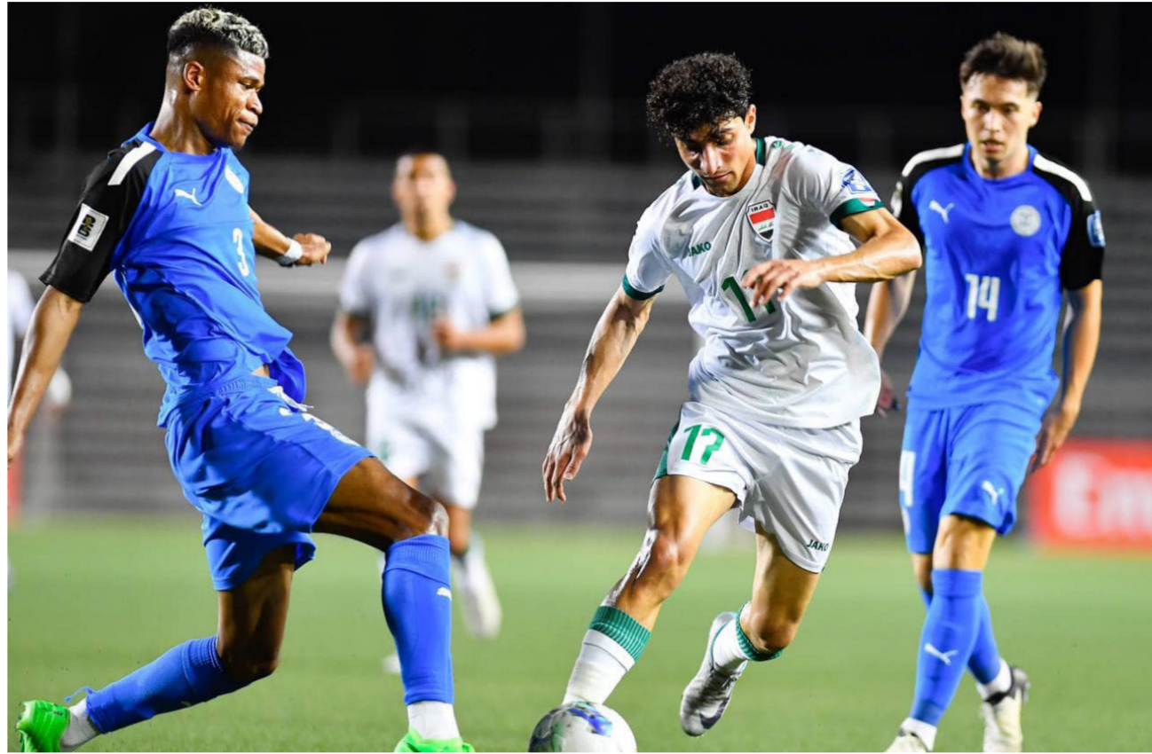
جانغ من مباراة منتخبنا الوطني امام الفلبين

الثالثة من التصفيات الآسيوية المؤهلة لكأس العالم 2026. وقال حسين. في تصريحات صحفية عقب المباراة: «مباركة للجمهور في العراق ومن حضر اليوم. الحمد لله 3 نقاط أهلنا لنهائيات أم آسيا 2027 وجعلنا في صدارة المجموعة.