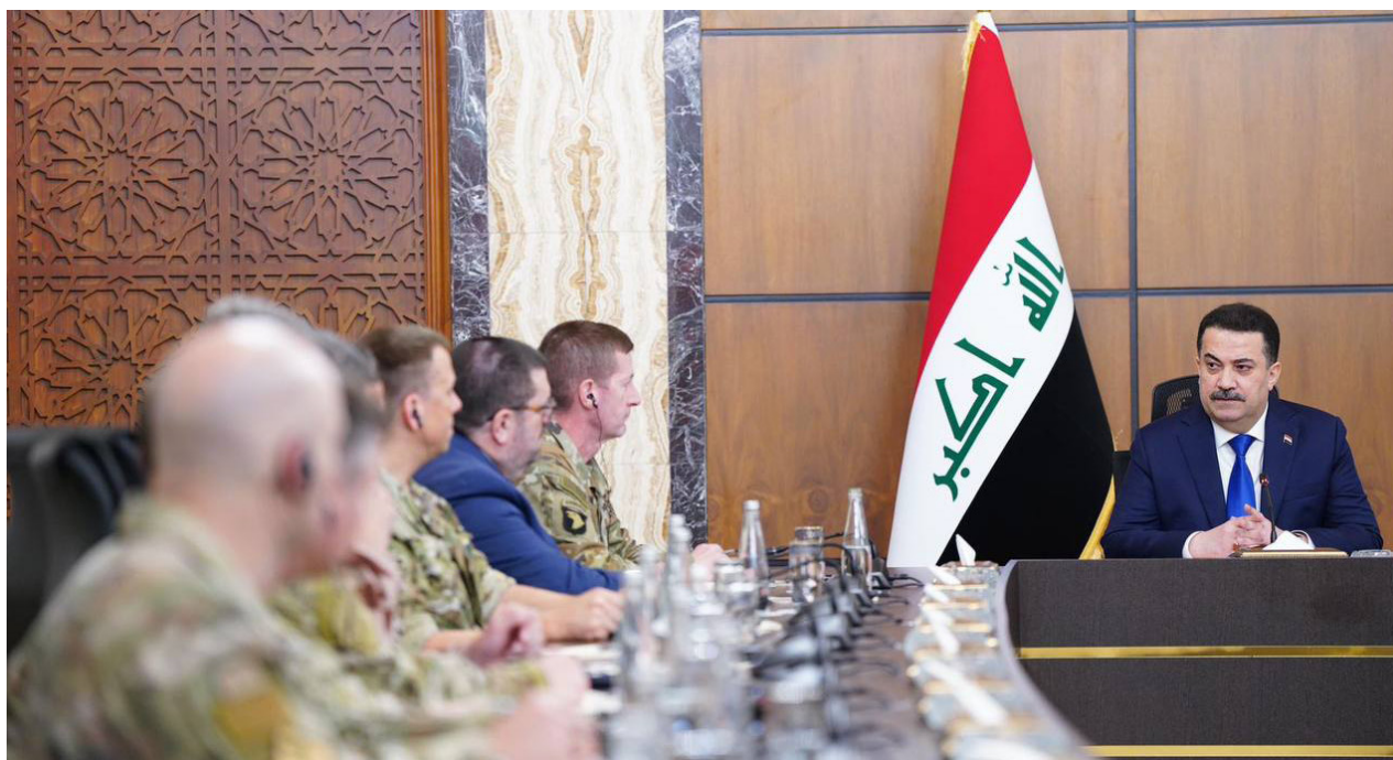
السوداني في جلسة حوار سابقة مع ممثلي التحالف الدولي

بشكل مباشر مع المسؤولين الأميركيين على سحب قواتهم من العراق وإنهاء مهام التحالف الدولي من العراق. وقد أفضت الجولة الأولى للحوار الثنائي التي عُقدت في بغداد في 27 كانون الثاني الماضي إلى اتفاق على تشكيل لجنة عسكرية مشتركة لمراجعة مهمة سيؤكد على الشراكة الأمنية والتعاون بين الجانبين. وقد بدأت اللجنة أعمالها في 11 شباط الماضي.