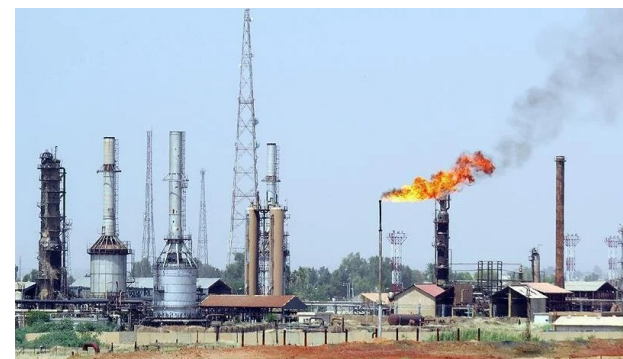
الخط كان العمل به متوقفا منذ سنوات حيث تعرض إلى اضرار بسبب أحداث داعش العام 2014.

وأكد المصدر أن «كوارث شعبة ضخ محطة K3 ويجهود ذاتية واستثنائية تمكنت من إعادة تشغيل المصخة الرابعة للمشروع التوقف عن العمل منذ العام 2014، حيث تم إجراء صيانة شاملة للمصخة الرئيسية والمحرك الكهربائي، ونصب عدد من أجهزة الحماية ومقاييس الضغط والحرارة بالتعاون مع شعبة كهرباء المنظومة الغربية، ووحدة الآلات الدقيقة، ووحدة السلامة والإطفاء في محطة K3». مؤكداً أن «العمل مستمر ومتواصل لإعادة تأهيل المضخات الأخرى المتوقفة عن العمل تبعاً» وأضاف المصدر أن «ملاكات شركة نفط الشمال في شعبة للمشروع التوقف عن العمل منذ العام 2014، حيث تم إجراء صيانة شاملة للمصخة الرئيسية والمحرك الكهربائي، ونصب عدد من أجهزة الحماية ومقاييس الضغط والحرارة بالتعاون مع شعبة كهرباء المنظومة الغربية، ووحدة الآلات الدقيقة، ووحدة السلامة والإطفاء في محطة K3». مؤكداً أن «العمل مستمر ومتواصل