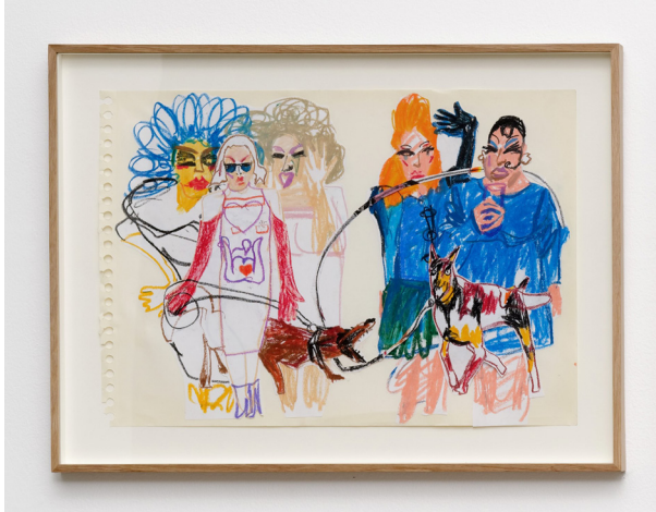
لوحة للإيرانية ترداد هامشي