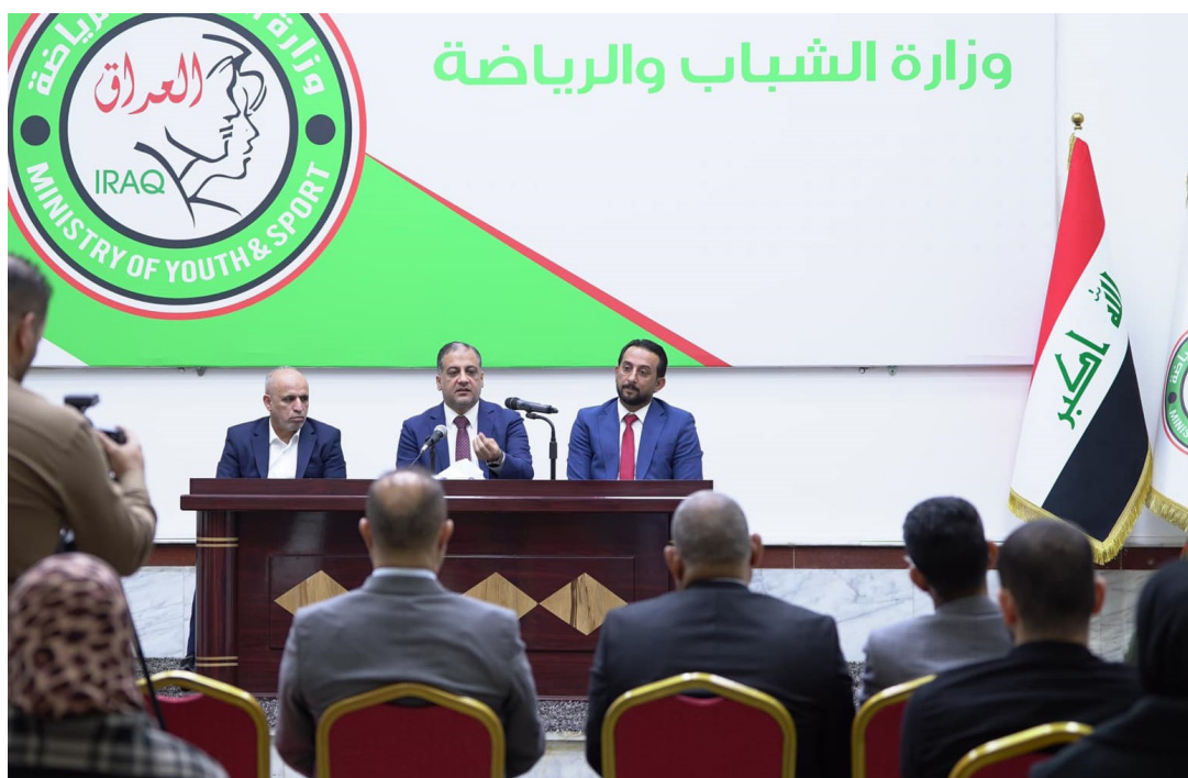
المبرقع في اجتماع وزارة الشباب والرياضة

اللازمة من اجل انصاف موظفي الوزارة. وأضاف السيد الوزير ان التواصل مع موظفي الوزارة بشكل مباشر والاستماع الى مقترحاتهم وارتهم، هو جزء من المسؤولية تجاه موظفي الوزارة والعمل على حل مشكلاتهم ضمن الصلاحيات. مبيناً انه وجه سكرتارية مكتب الوزير على استقبال اي موظف لديه مشكلة بغية حلها، وان اسباب مكتبه مفتوح لهم، من جانبه قدم مدير عام دائرة الاستثمار وموظفيه شكرهم وتقديرهم لرحابة صدر الوزير في الاستماع الى المشاكل والمعوقات التي تواجههم، من جانب آخر، وتنفيذا لتوجيهات وزير الشباب والرياضة الدكتور احمد المبرقع، أعلنت وزارة الشباب والرياضة دائرة التربية البدنية والرياضة تنفيذها لبرنامج تدريب سبعة ٢٠٠٠ متفرج وملعبان تدريب سبعة ٥٠٠ متفرج وفتقد سبعة ٧٥ غرفة. وفي سياق آخر بتوجيه من وزير الشباب والرياضة الدكتور احمد المبرقع وبإشراف مدير شباب ورياضة كركوك عددي عواد افتتح مركز الابتكار للتعليم الرقمي الثاني في مديرية شباب ورياضة كركوك بالتعاون مع منظمة حماية أطفال كردستان