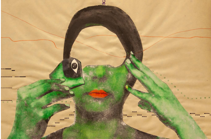
لوحة في المعرض للرسم الفلسطينية السورية بيسان الشريف