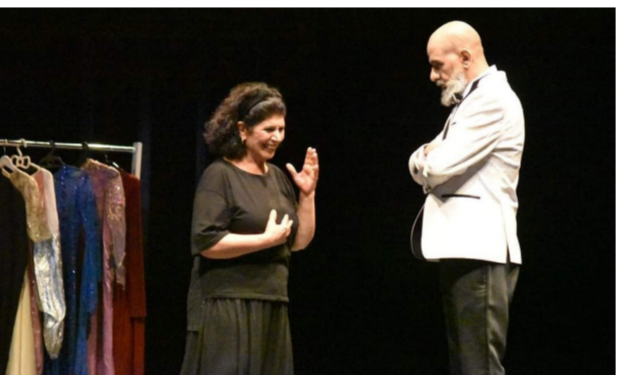
فصولاً من معاناة الشعب الفلسطيني في ظل الاحتلال الصهيوني ونضاله اليومي من أجل الحرية.

الاستثنائية لكادر المسرحية من ادرين وفينين ودائرة السنيما المسرح والسيرك، وهو عمل جزائري بأداء عربي مشترك مهدي لفلسطين، ضيف شرف، من تأليف جمال لعبيدي وإخراج فارس رضوانة، ويسري العرض