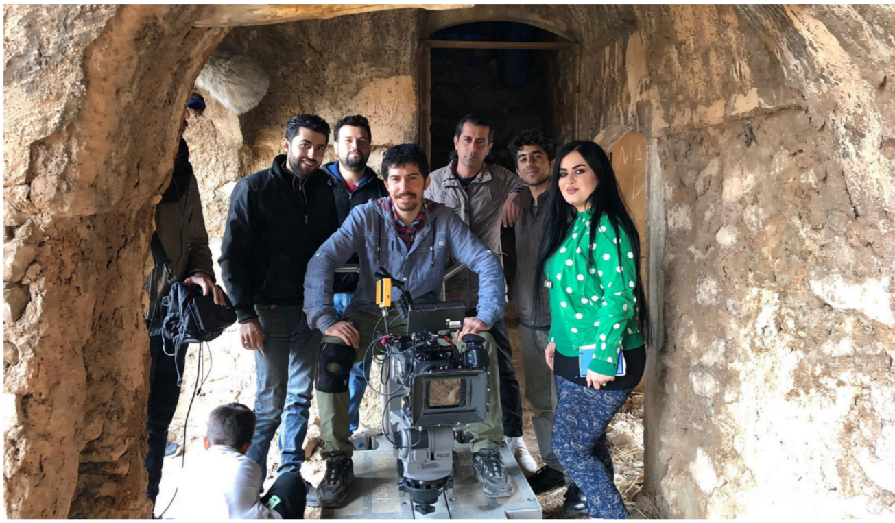
كاردينيا هيمن أثناء تصوير أحد أفلامها

مصاعب "حدثينا عن أفلامك الأخرى التي قمت بإخراجها؟ كـمـمـرـجـة، لدي في أرشييفي أربعة أفلام قصيرة، أما على صعيد التمثيل فشأركت كـمـمـثـلـة في خمسة عشر فيلماً قصيراً، إضافة لسلسلة تلفزيونية وفيلم طويل. الأفلام التي قمت بإخراجها هي: "حياة" و"رائحة الدم" وفيلم "الاول" صرخة من أجل الحياة" إضافة لفيلم "يد امي"، أما على صعيد الجوائز فحصلت العديد من الجوائز في الأخرى. في بغداد مثلاً حصلت على جائزة أفضل فيلم وأفضل ممثلة في الملتقى السنوي الأول، في لبنان حصلت على جائزة أفضل تصوير عن فيلمي "يد امي"، وكذلك جائزة أفضل سيناريو في كازاخستان، كما حصلت على جائزة أفضل ممثلة خلال مهرجان السينما ضد الأهاب بنسخته الثالثة في أربيل عن فيلم "الحياة".