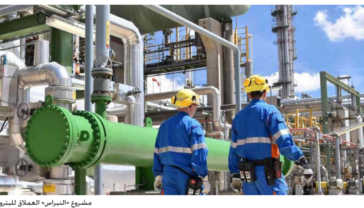
مشروع «النبراس» العملاق للبترولية