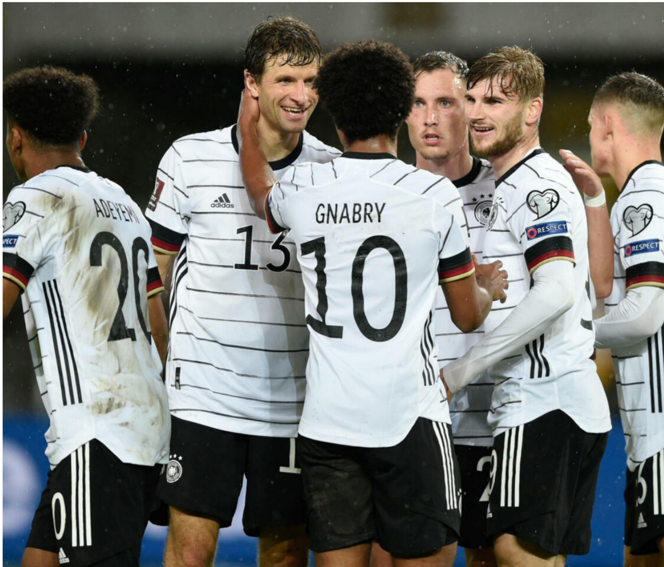
لاعبو منتخب ألمانيا بكرة القدم

كما يستعد منتخب إنجلترا للمشاركة في كأس أم أوروبا لكرة القدم (يورو 2024) في ألمانيا بمواجهتين وديتين أمام البوسنة والهرسك وأيسلندا. ويلتقي منتخب إنجلترا مع نظيره البوسنة والهرسك للمرة الأولى وستقام المباراة على ملعب سانت جيمس بارك معقل نيوكاسل يونايتد يوم الثالث من حزيران المقبل. وبعدها بأربعة أيام سيستضيف منتخب أيسلندا على استاد ويلي. ولم يضمن منتخب البوسنة والهرسك وأيسلندا بعد التأهل إلى يورو 2024 حيث يشاركان في الملحق الفاصل المؤهل للبطولة. والذي تقام فعالياته في آذار المقبل. وتطلق يورو 2024 في 14 حزيران المقبل. ويبحث منتخب إنجلترا عن أول لقب بطولة كبرى منذ تنويعه كأس العالم 1966. حيث يلعب في مجموعة واحدة إلى جانب صربيا والدنمارك وسلوفينيا.