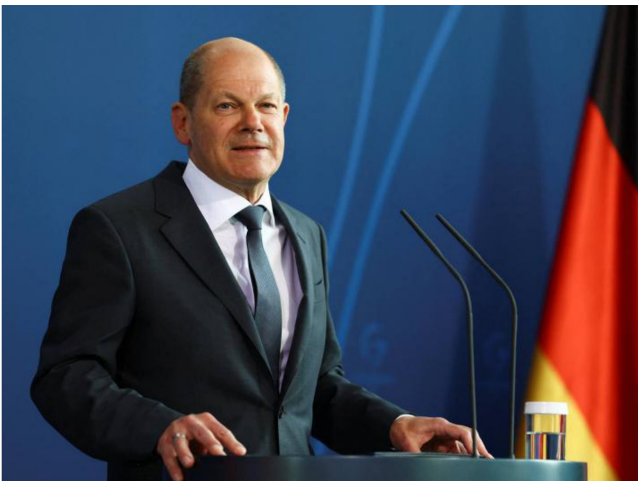
المستشار الألماني، أولاف شولتز

وتتشدد إسرائيل دائماً في إطار تحسبها بأن الهدد من الحرب هو القضاء على حماس على أنها تلتزم بالقانون الدولي ولا تخالفه.