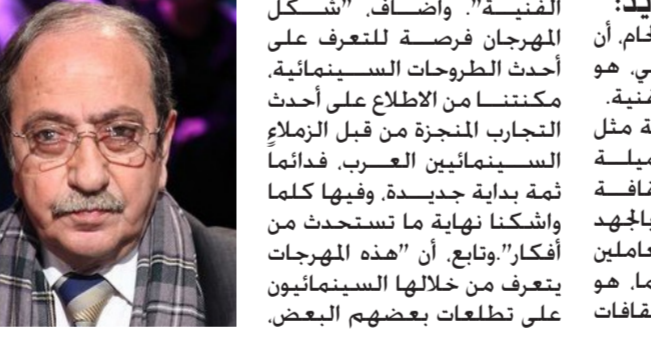
بغداد - الصباح الجديد: أكد الفنان السوري دريد لحام. أن مهرجان بغداد السينمائي. هو فرصة لتبادل الثقافات الفنية. وقال لحام: إن "إقامة مثل هكذا مهرجانات جميلة ومتكاملة تغني ثقافة الجمهور وتعرفهم بالجدد المبدول. من قبل العاملين في صناعة السينما. وبتعرف من خلالها السينمائيون فرصة لتبادل الثقافات

للتعاون في سبيل تحقيقها". منوها بأن "وجد بغداد أجمل ما غنى لها الفنان فريد الأطرش. ضمن أوبريت "بساط الريح". وختم الفنان دريد لحام. متهماً: "روح بساط على بغداد. بلاد خيرات. بلاد أمجاد. تلك هي بغداد. بلد خير ومجد" مؤكداً ان "الفن العراقي رائع. وثقافة الفنانين ودائرة السينما والمسرح. تتحركان بجد ومواظبة".