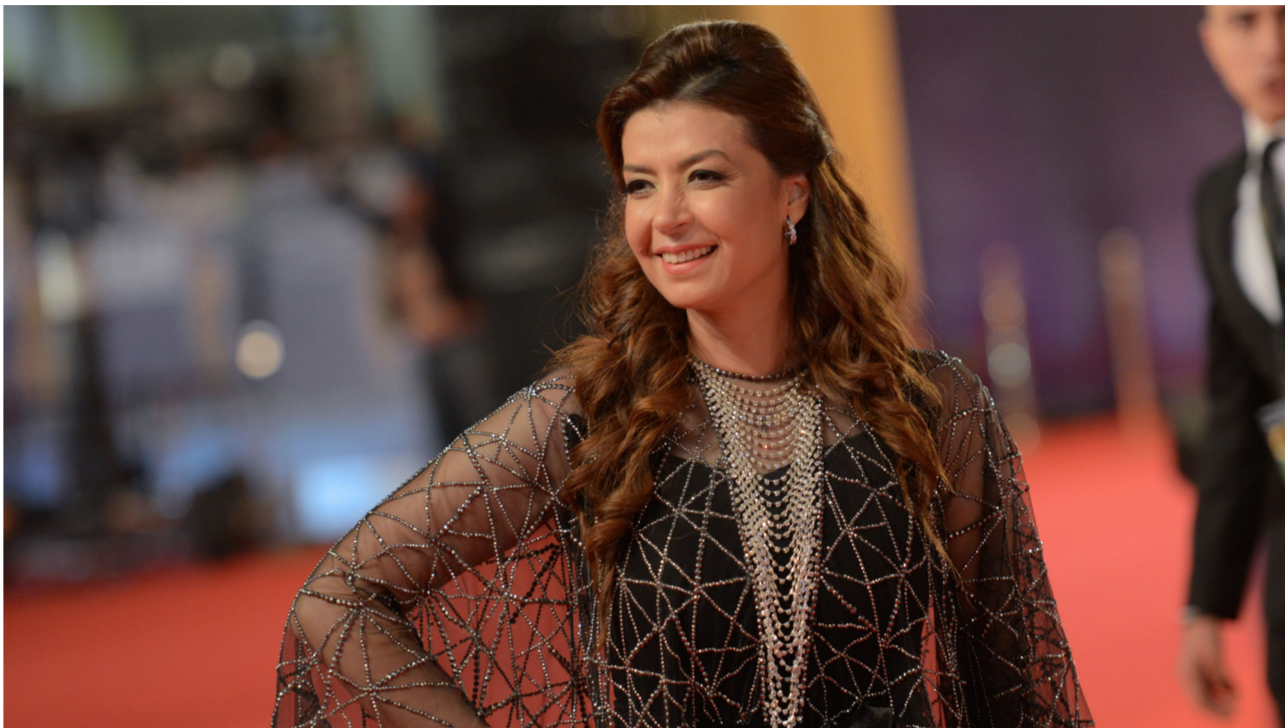
بغداد. سمير خليل:

خل النجمة المصرية منال سلامة ضيفة على بغداد مشاركة في مهرجان بغداد السينمائي. وعن هذه الزيارة خدت للصباح الجديد وقالت: «أنا أحب بغداد كثيراً. زرتها عام 2012 وكان الظرف صعب قليلاً. لم نستطع التجوال بمفردين في الشوارع. كنا دائماً محاطين بحماية أمنية. العام الماضي كنت ضيفة على مهرجان بغداد الدولي للمسرح الذي أقيم خلال شهر تشرين الأول الماضي. أحسست باختلاف الوضع أكثر أماناً وراحة. كنت أجول براحتي لوحدي وأتسوق. طبعاً الأمن والأمان أكثر كثيراً من العام 2012. هذه المرة أكثر وأنا سعيدة بعودة الأنشطة الفنية في بغداد وأتمنى أن تنتشر في ربوع العراق جميعاً».