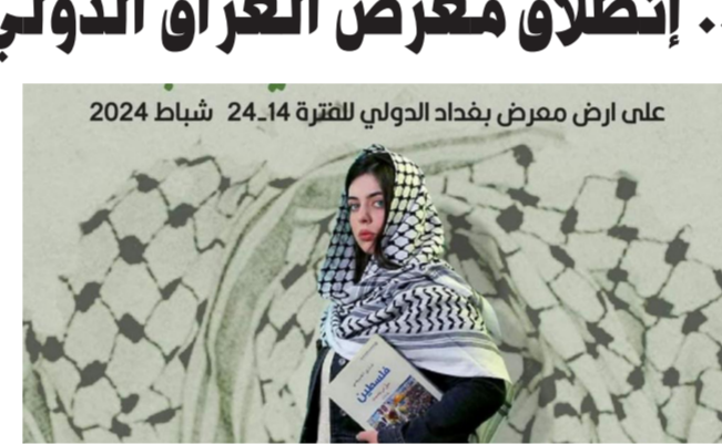
على أرض معرض بغداد الدولي للفترة 24-14 شباط 2024

في دورته الرابعة. وفي لفته تضامنية مع الشعب الفلسطيني الذي يتعرض لإيادته جماعية في قطاع غزة منذ أكثر من أربعة أشهر. أطلق القائمون على الدورة اسم فلسطين: التي خضرت في المعرض على أكثر من مستوى: بدءاً من الملصق الذي تظهر فيه شابات توشحن الكوفية الفلسطينية وختم كتاباً عنوانه "فلسطين". وتقف