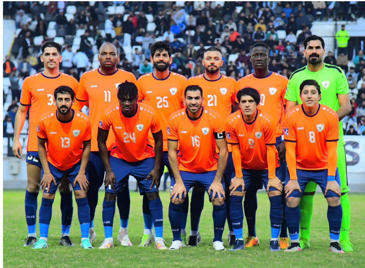
فريق نادي الكهرباء بكرة القدم