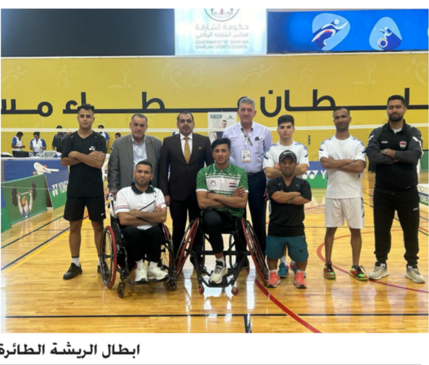
إبطال الريشة الطائرة