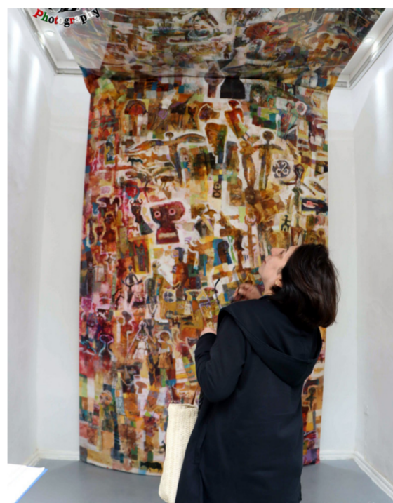
طريقة مشاهدة لوحة المعرض

الحضارات المجاورة باشكال مختلفة والتي جدها تعود للظهور في التداول المعاصر. واللوحة الوحيدة والمتميزة. التي سباح فيها الفنان عمران. سباحة فكرية -