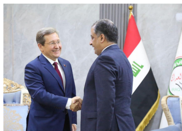
المبرقع والسفير البيلاروسيا

من جانبه، عبر السفير الرياضي، وامتلاكهم للاعبين مصنفين على مستوى العالم، مستعرضاً مدى إمكانية مشاركة العراق في البطولات التي تقام في خلال الهدى المقبلة. وقدم رايابك وشرحاً موجزاً عن الرياضة في بلده، وتطور الفعاليات الشبابية والرياضية.