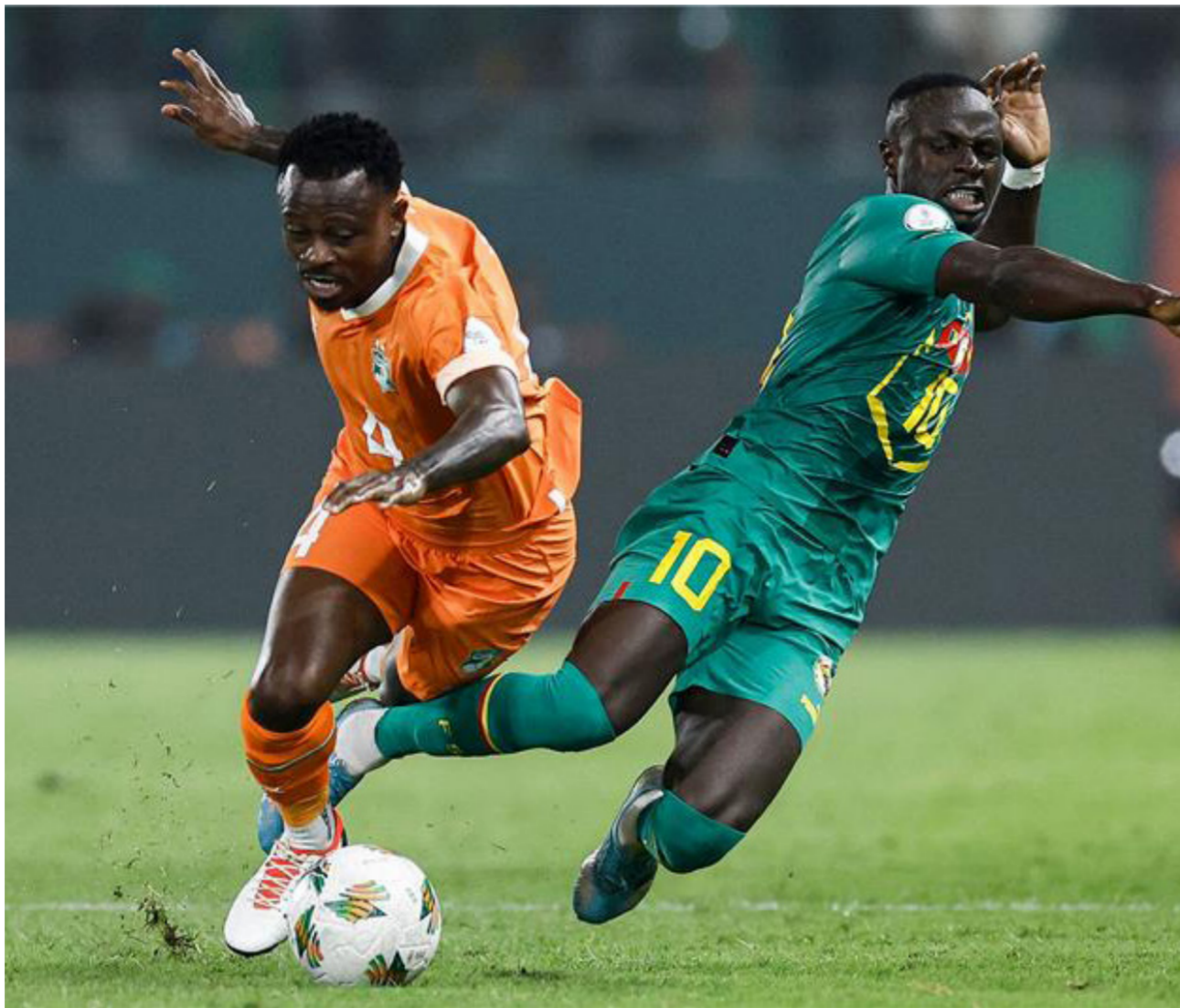
أفيال كوت ديفوار تطيح بالسنگال