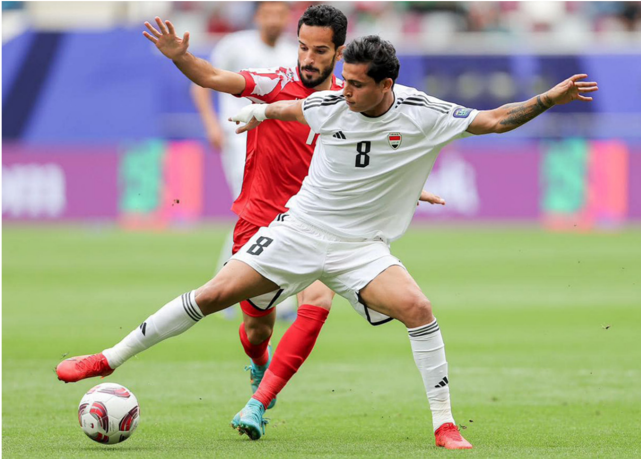
بايش في محاولة لاجتياز لاعب أردني بكأس آسيا

كما أشاد وزير الشباب والرياضة الدكتور أحمد البرقع بالمستوى والاداء الذي قدمه المنتخب العراقي في بطولة كأس آسيا لكرة القدم الجارية أحداثها في الدوحة، بالرغم من توقف المنتخب عند عتبة الدور السادس عشر بعد الخسارة في سبيناوي غير متوقع أمام الأردن بثلاثة أهداف لهدفين. وبين الوزير البرقع أننا كسبنا منتخباً كبيراً بلاعبيه وحرصهم على تقدم الأفضل وهم يرتدون قميص المنتخب وقد حققوا نتائج مميزة في الدور الأول، مثمناً الدور الرائع لجمهيراتنا الجيرة التي أزرنا المنتخب ووقفت معه بإخلاص من جانبه. قال كاساس مدرب منتخب العراق: إن الحكم علي رضا فغانى، الذي أدار لقاء