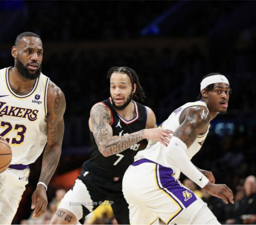
دوري السلة الأميركي

بفارق تسع نقاط مع بداية الربع الأخير ولكنه قلب الطاولة وتقدم بفارق ست نقاط (100-106) بفضل سلة لانتوني إدواردز قبل 3:53 دقائق من نهاية المباراة، لكن رجال المدرب جايسون كيد ردوا بقوة بتسجيل 13 نقطة متتالية أستهلها إرفينغ بثلاثية أدرك بها التعادل 106-106، ثم أتبعها بأخري اثر سرقة للكرة من الفرنسي رودي غوبير، وحقق نيو أورلينز بيليكانز فوزا كبيرا على مضيفه ساسكارامنتو كينغز 100-133 بفضل 30 نقطة لسي جاي ماكولوم، وحذا حذوه تورونتو رايتورز بتغلبه على مضيفه غولدن ستايت ووريترز 118-133 بفضل 37 نقطة لآر جاي بارت وستغفلا أسمية مخيبة لنجم أصحاب الأرض ستيفن كوري الذي اكتفى بتسجيل تسع نقاط فقط.