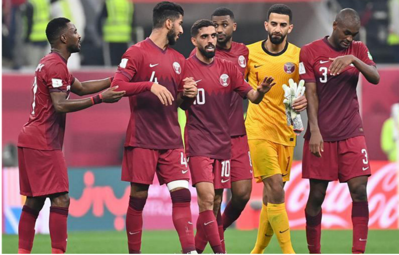
لاعبو المنتخب القطري