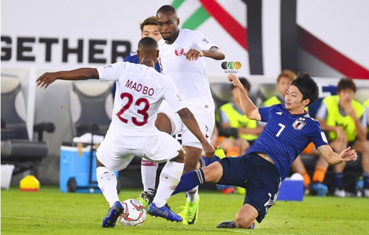
قطر واليابان يفتتحان أمم آسيا