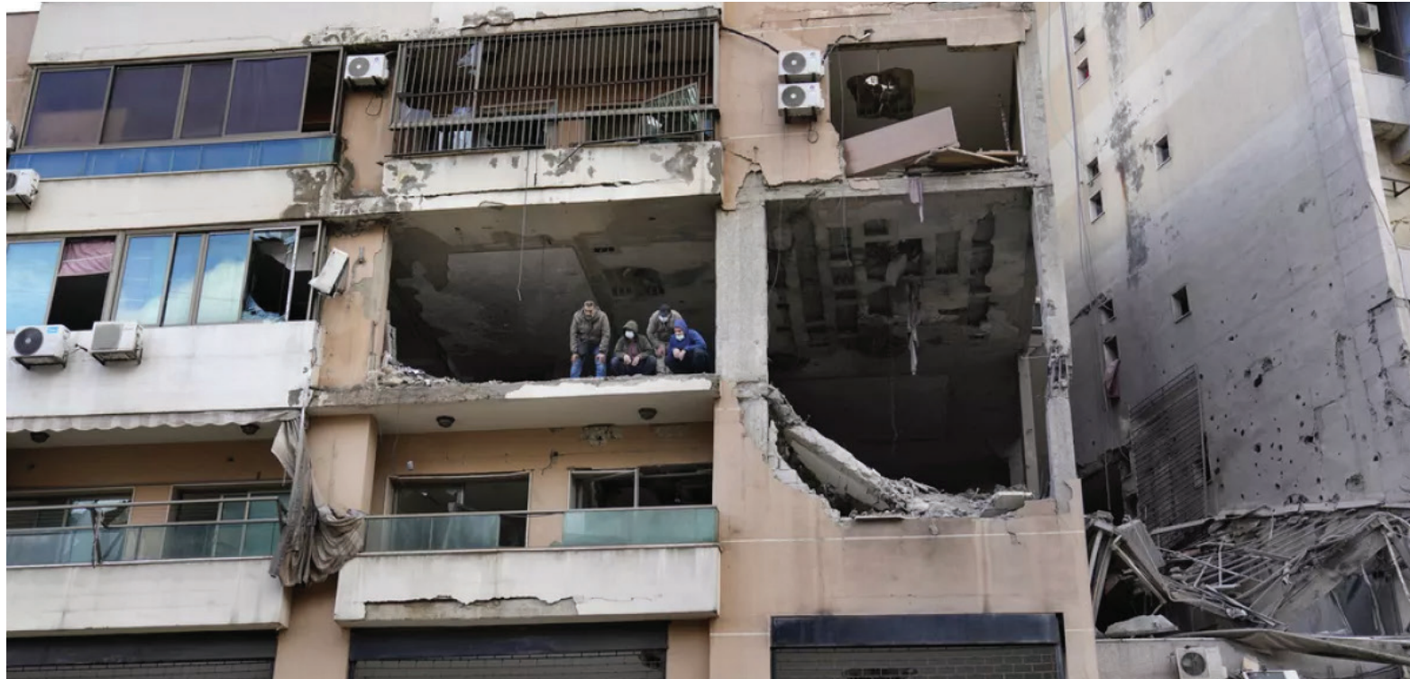
موقع مقتل صالح العاروري في الضاحية الجنوبية في بيروت

شيء نقوله الليلة هو أننا في حالة تركيز وبقوى اهتمامنا منصبا على قتال حماس".