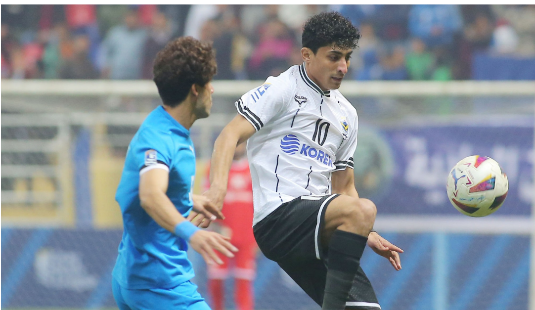
جانب من لقاء الجوية والنجف في دوري النجوم

وحافظ فريق الزوراء على مركزه الثالث برغم التعادل الذي حقق مع ضيفه فريق النفط بهدف لثله. تقدم النوارس في الدقيقة 10 عن طريق المحترف كوليتز