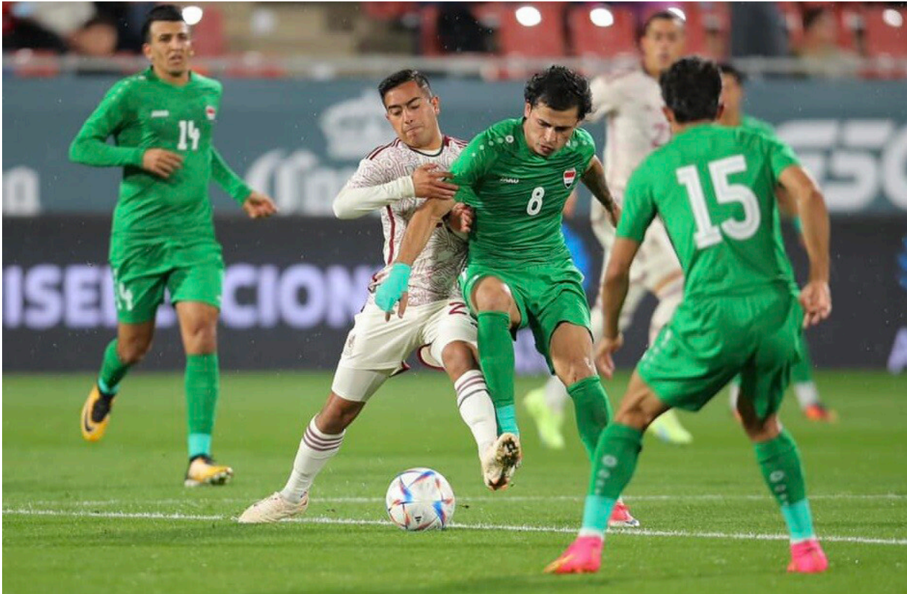
منتخبنا الوطني في مباراة سابقة