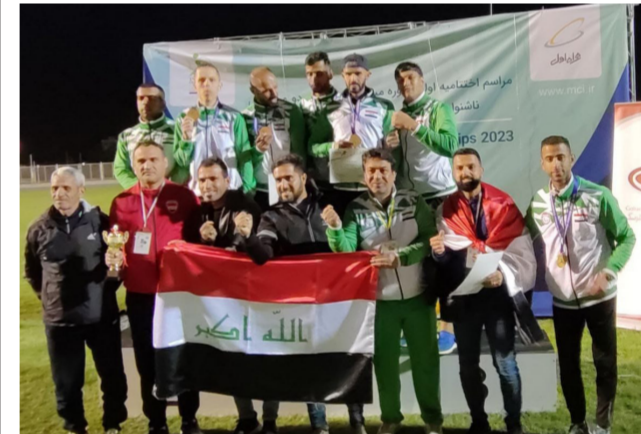
ابطال ألعاب القوى للصم والبكم

إلى ذلك ويتوجه مباشرة من وزير الشباب والرياضة الدكتور أحمد المبرقع. واصلت وزارة الشباب والرياضة، حملة (عراق أخضر)، التي ينفذها كسبم العمل التطوعي. وتتضمن غرس الشتلات الزراعية، في المدارس والجامعات، والأرقعة، بالتعاون مع الفرق التطوعية، إذ شملت الحملة، بعض من مناطق بغداد وهي: البلديات، وحى التراث.