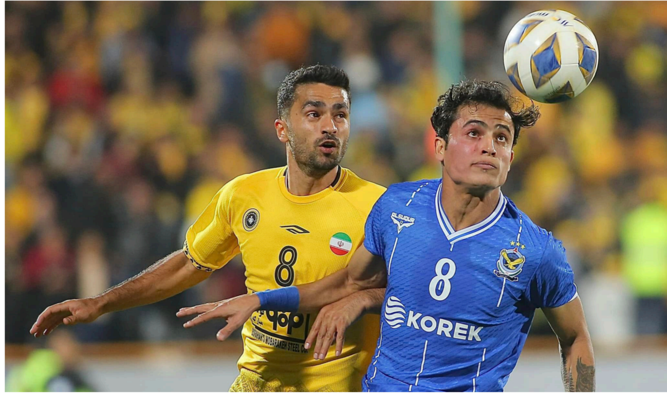
جانب من لقاء الجوية وسباهان الإيراني