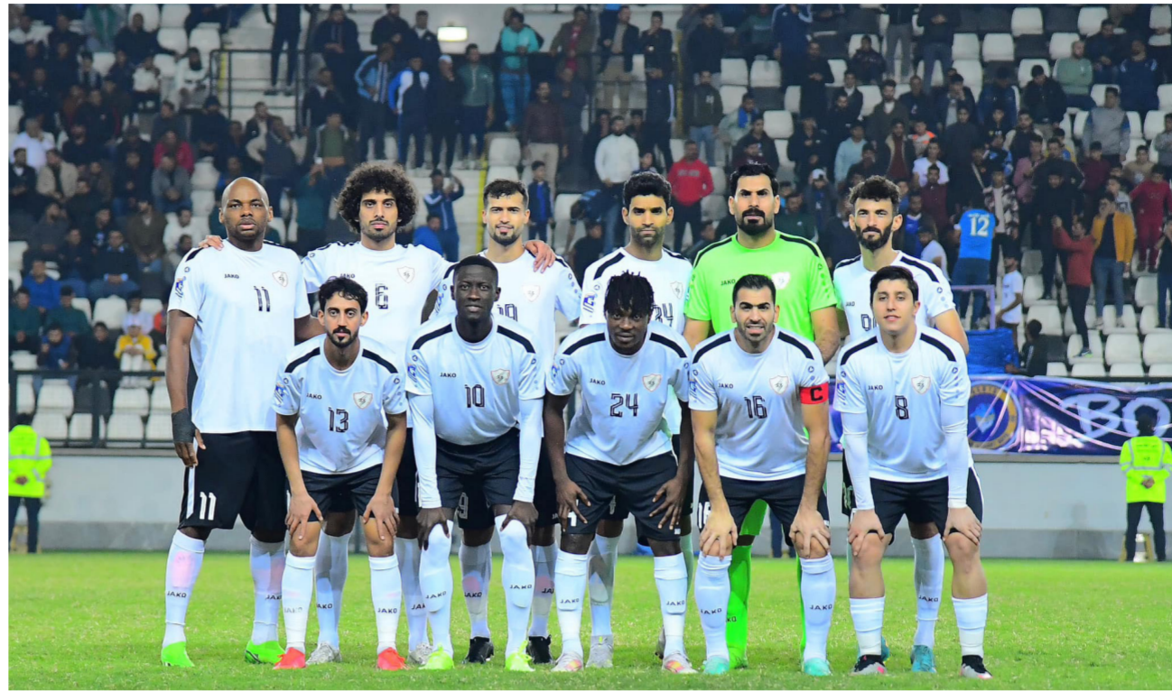
فريق نادي الكهرباء

من جانب آخر، زار رئيس الاتحاد العراقي لكرة القدم «عدنان درجال» رئيس الاتحاد القطري لكرة القدم «جاسم بن راشد البوعيين» في مكتبه بمقر الاتحاد القطري، أمس، وتم في اللقاء التباحث في المواضيع ذات الاهتمام المشترك، والسعي لتعزيز أفاق التعاون بما يخدم الاتحادين في مجال كرة القدم. وفي سياق آخر، إطمأن أعضاء الاتحاد العراقي لكرة القدم