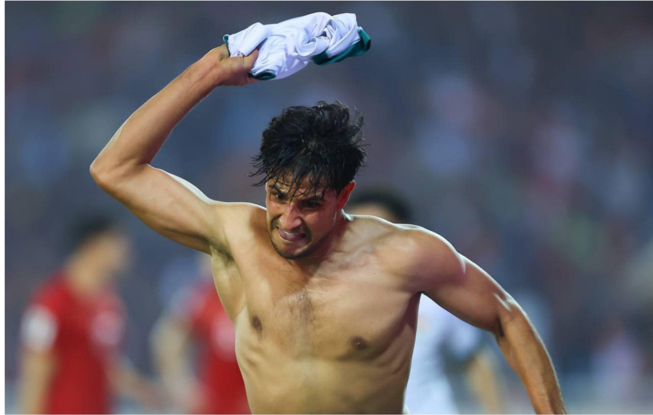
ميمي يطلق صرخة النصر العراقي في فيتنام

يشير إلى ان منتخبنا الوطني يقوده الملك التدريبي الإسباني بقيادة خيسوس كاساس.