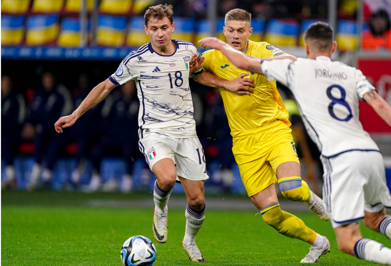
إيطاليا تبليغ يورو