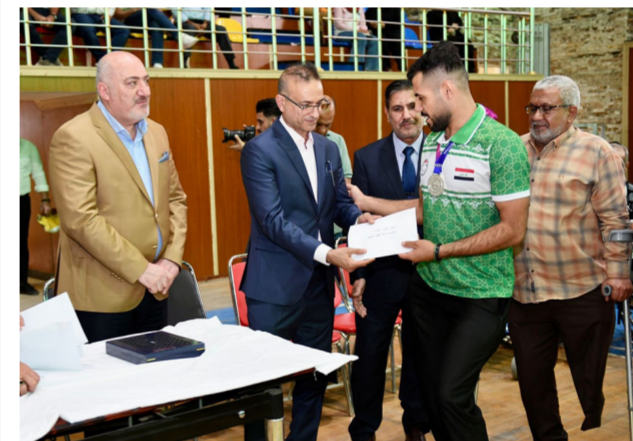
البارالمبية تكرم أبطال الاسباء