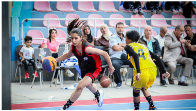
جانب من البطولة

وزعت السدوع بين الفرق المشاركة. وفي نهاية البطولة المستمرة.