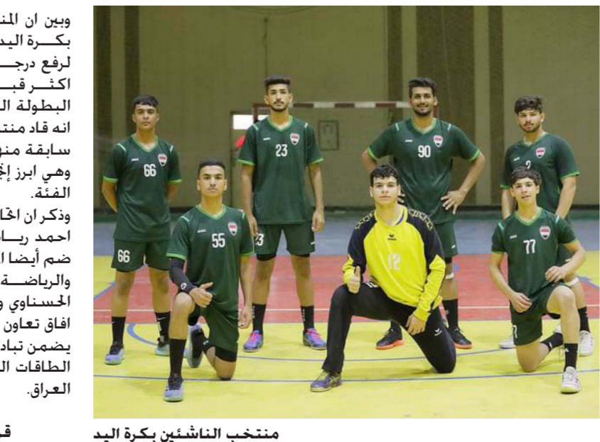
منتخب الناشئين بكرة اليد

وبين ان المنتخب الوطني للناشئين بكرة اليد يحتاج نحو 12 مباراة ودية لرفع درجة وكفاءة اللاعبين بنحو اكثر قبيل الدخول في منافسات البطولة العربية للناشئين. وأوضح انه قاد منتخب الناشئين في محطات سابقة منها الفوز بالترتيب السادس وهي أبرز إنجاز حقق للعراق في هذه الفئة. وذكر ان اتحاد اللعبة برئاسة الدكتور احمد رياض عقد مؤخرًا اجتماعاً ضم أيضاً المتحدث مع وزارة الشباب والرياضة بثلة الدكتور حسن الحسناوي والكابتن عامر طالب لفتح افاق تعاون متواصلة وتعزيز العمل بما يضمن تبادل الخبرات والاستفادة من الطاقات الواعدة لخدمة اللعبة في العراق.