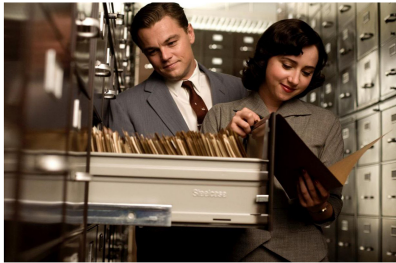
مهما حاولت السينما أن تتحرر من سلطة الواقع وتاريخه فهي مدعوة ضمناً إلى الانخراط فيه

والسينما نفسها حين تتقل من كونها خطاباً جمالياً تخييلياً إلى خطاب أيديولوجي. إن السينما مهما حاولت أن تتحرر من سلطة الواقع وتاريخه فهي مدعوة بطريقة ضمنية إلى الانخراط فيه. كونها عبارة عن وسيط بصري يحمل في باطنه خطاباً احتجاجياً حتى