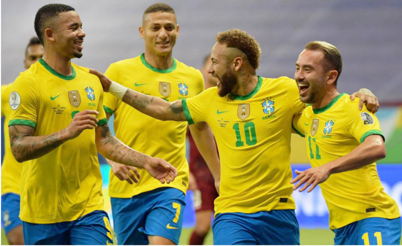
البرازيل تلاقي فنزويلا فجر غد