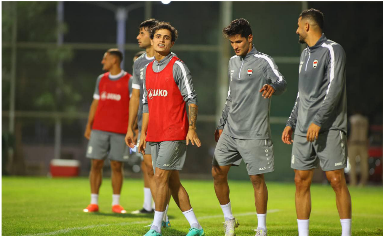
لاعبو منتخبنا الوطني في الوحدة التدريبية أمس

يخوض منتخب الشباب مباراتين وديتين أمام نظيره الإماراتي في الثالث عشر والسابع عشر في الإمارات بناءً على دعوة خاصة من الأشقاء.