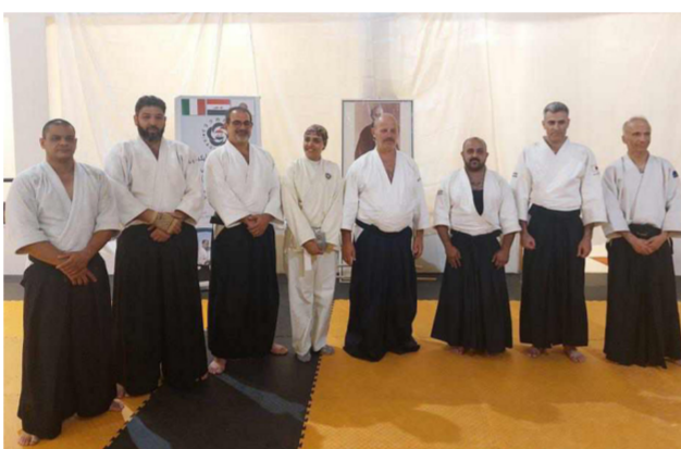
الايكيدو تستقدم خبراء وإبطال