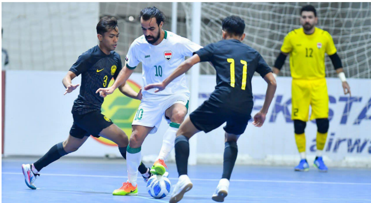
الصالات يستعد للقاء كمبوديا اليوم