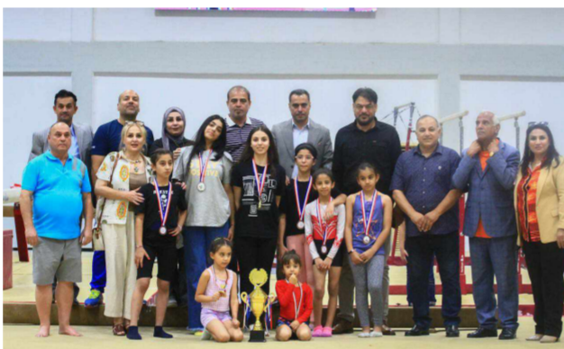
تتويج فريق السياحة بأوسمة الجمايز