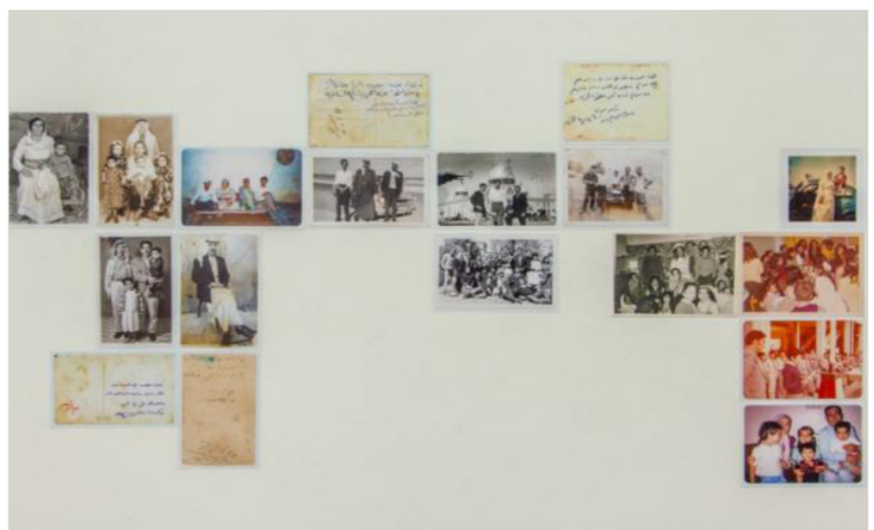
من معرض «في تتبع الترحال والرحيل» في «دائرة الفنون»

في هذا السياق، تستقبل «دائرة الفنون» طلبات المشاركة في برنامج «مشاريع