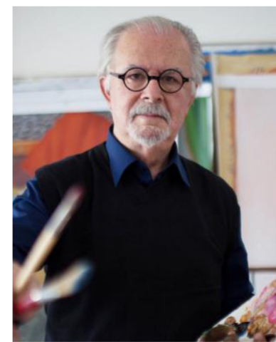
فيرناندو بوتيرو (1932 -2023) في مرسمه

التماسك والجماليات. لكنني رسمت العنف والتعذيب وآلم المسح... هناك متعة مختلفة في الرسم الدرامي. في الرسم نفسه. أعظم متعة في الرسم هي دون أدنى شكّ الجمال». يقول الفنان الكولومبي. يحدّ بوتيرو من أبرز فنّاني أميركا اللاتينية وأحد أهمّ الرسّامين والنّحاتين العالميين المعاصرين. تنتشر