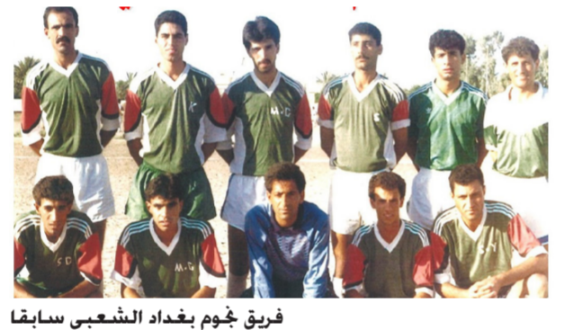
فريق نجوم بغداد الشعبي سابقا