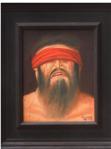
من سلسلة «لا تستح من الحقيقة»

أرّخ الفنان التشكيلي الكولومبي المعاصر لفظاعة ألم الجسد. وشعور النذل البشري. وانكسار الإنسانية المستباحة. عندما غافل العالم عام 2006 بتحوّله عن موضوعاته المألوفة في رسم النساء السمينات والرجال والأطفال الضخام من الطبقات الاجتماعيّة المختلفة في أميركا اللاتينية إلى لوحات جسّد مأساة مشاهد التعذيب وأحداثها البشعة في «سجن أبو غريب» بالعراق. ففي رسوماته التي حملت عنوان «لا تستح من الحقيقة» والمرقمة من 1) حتى 60) وتضمّ عملين ضخمين. إلى جانب عشرات الرسوم متوسّطة الحجم.