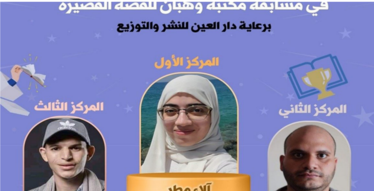
الفائزون في المسابقة

ويبلغ عدد المشاركات من مصر 296 قصة. ومن سوريا 13 قصة. ومن الجزائر 9 قصص. ومن المغرب 8 قصص. ومن العراق 7 قصص.