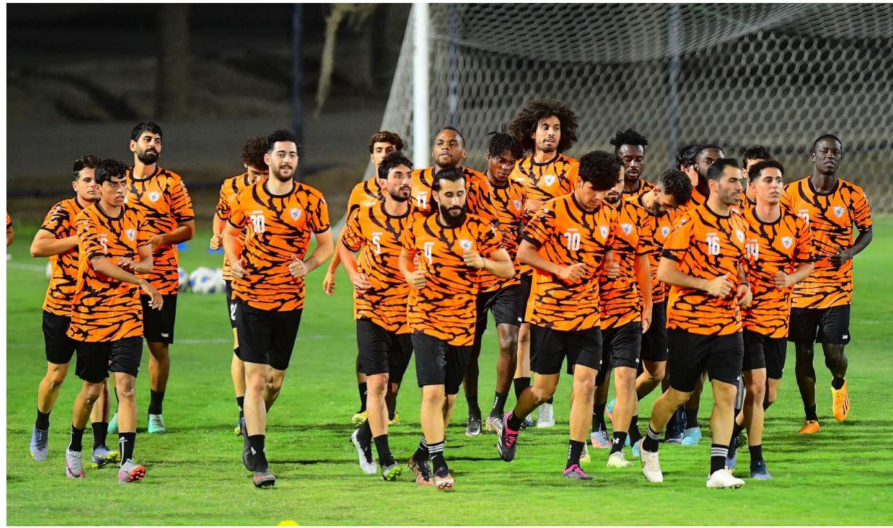
تدريبات كرة الكهرباء خضيرا لمواجهة الكويت الكويتي اليوم