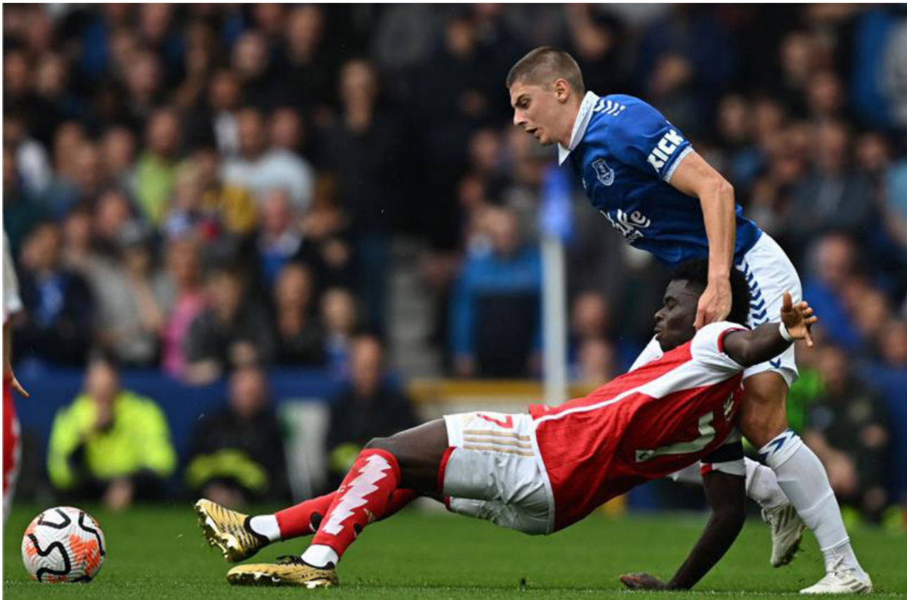
ارسنال يتغلب على إيفرتون في الدوري الإنجليزي

وعاد هايدنهايم ليتقدم مجدداً في النتيجة، بعدما سجل له دينكجي الهدف الثالث في الدقيقة 68، فيما أضاف يان نيكولاس بيست الهدف الرابع في الدقيقة 76. ورفع هايدنهايم الذي حقق فوزه الأول بعد تعادل وهزمتين، رصيده إلى 4 نقاط في المركز 11، فيما تجدد رصيد برين عند 3 نقاط في المركز 12.