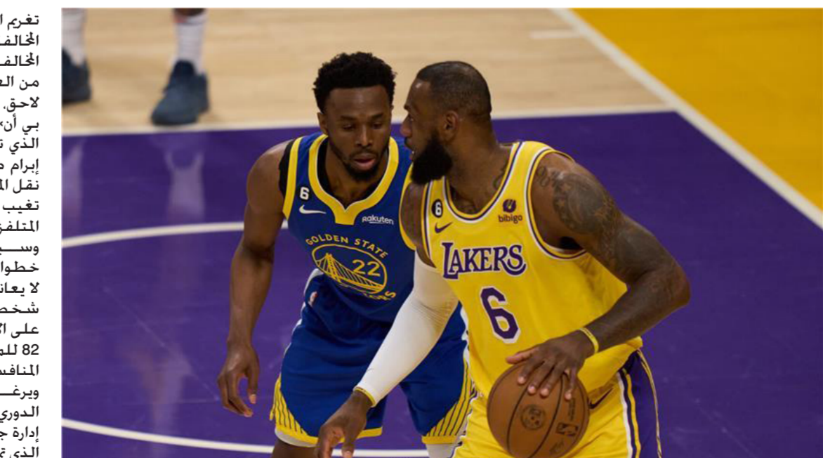
دوري سلة المحترفين

وسبق لرابطة الدوري، أن اتخذت خطوات لمنع تغيب اللاعبين الذين لا يعانون من إصابة أو مشاكل شخصية، فإرضاء عليهم المشاركة على الأقل في 65 من أصل المباريات 82 للموسم المنتظم، إذا ما أرادوا المنافسة على جائزة أفضل لاعب، ويرغب اللاعبون أن تعالج رابطة الدوري، المتطلبات التي تدفعهم إلى إدارة جهودهم خلال الموسم المنتظم الذي تمتد مبارياته لنحو 6 أشهر، لا سيما مع استحداث مسابقة كأس «إن بي أيه» التي تقام مبارياتها يومي الثلاثاء والجمعة اعتبارا من 3 تشرين الثاني وصولا إلى النهائي في 7 كانون أول.