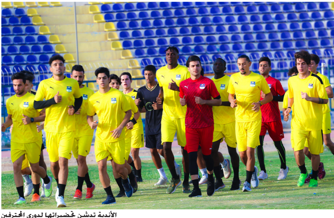
الأندية تدهن تحضيراتها لدوري المحترفين