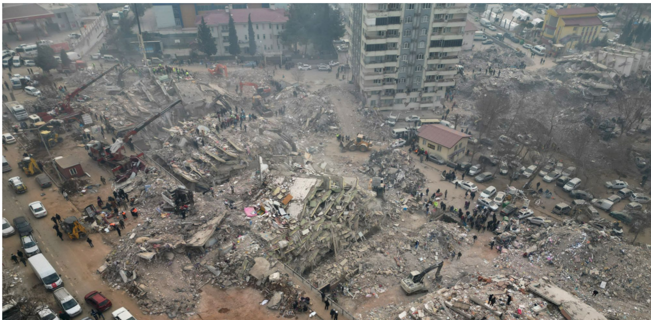
متابعة - الصباح الجديد:

أدى الزلزال الذي ضرب المغرب إلى أضرار في المباني التاريخية لمدينة مراكش القديمة، التي تضم مواقع مصنفة على قائمة التراث العالمي لليونسكو. وبحسب شبكة «سي إن إن» الأميركية، فإن بعض الأجزاء من الأسوار الحمراء التاريخية التي تحيط بمدينة مراكش القديمة، انهارت جراء الزلزال. ويعد هذا الزلزال الأعنف الذي يضرب المغرب، إذ بلغت قوته سبعة درجات على مقياس ريختر. بحسب المركز الوطني للبحث العلمي والتقني وأسفر الزلزال عن مقتل أكثر من ألفي شخص، وقد أعلنت المملكة الواقعة في شمال أفريقيا حدادا وطنيا لمدة ثلاثة أيام.