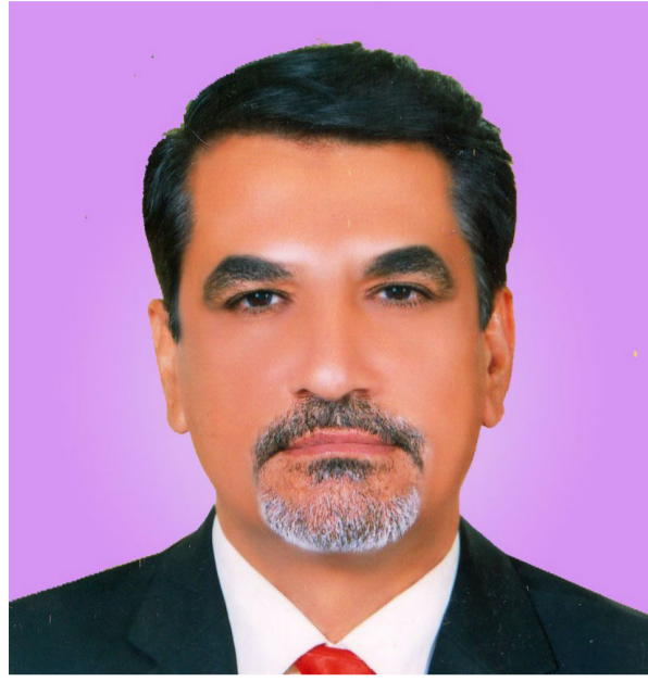
الروائي سالم بخشي