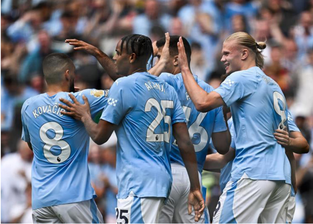
هالاند يحتفل مع رفاقه بفوز مانشستر سيتي

وانتهى الشوط الأول بالتعادل بهدف لثله حيث تقدم النيجيري فيكتور بونيفاس بهدف ليفركوزن في الدقيقة 21. لكن بعد 4 دقائق فقط أدرك السويدي أوسكار فيلهلمسون التعادل لدارمشتاد.. وفي الشوط الثاني أضاف الأرجنتيني إزيكيل بالاسيوس الهدف الثاني ليفركوزن في الدقيقة 49 ثم تبعه فيكتور بونيفاس بتسجيل الهدف الثاني له والثالث لفريقه في الدقيقة 61. ثم أحرز جوناس هوفمان الهدف الرابع لباير ليفركوزن في الدقيقة 67. بينما تكفل التشيكي آدم هلويزيك بتسجيل الهدف الخامس في الدقيقة 83 ورفع باير ليفركوزن رصيده في الصدارة إلى 9 نقاط وظل دارمشتاد في المركز الأخير من دون رصيد.