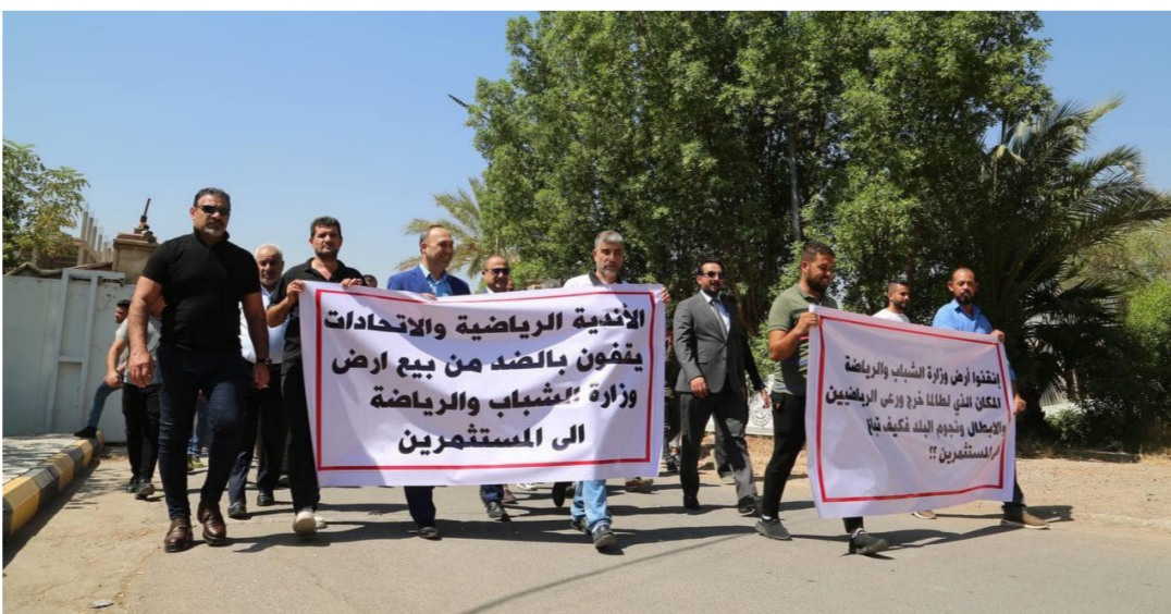
احتجاجات موظفي وزارة الشباب والرياضة

والشاطئية وغيرها. من جانب اخر استكمل قسم إدارة الجودة الشاملة والتطوير المؤسسي في وزارة الشباب والرياضة، المرحلة الأولى من تأهيل ملعب كربلاء