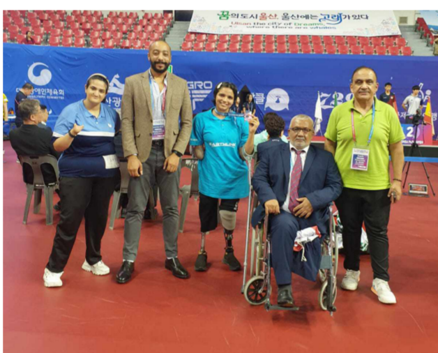
ابطال كرة الطاولة البارالمبية