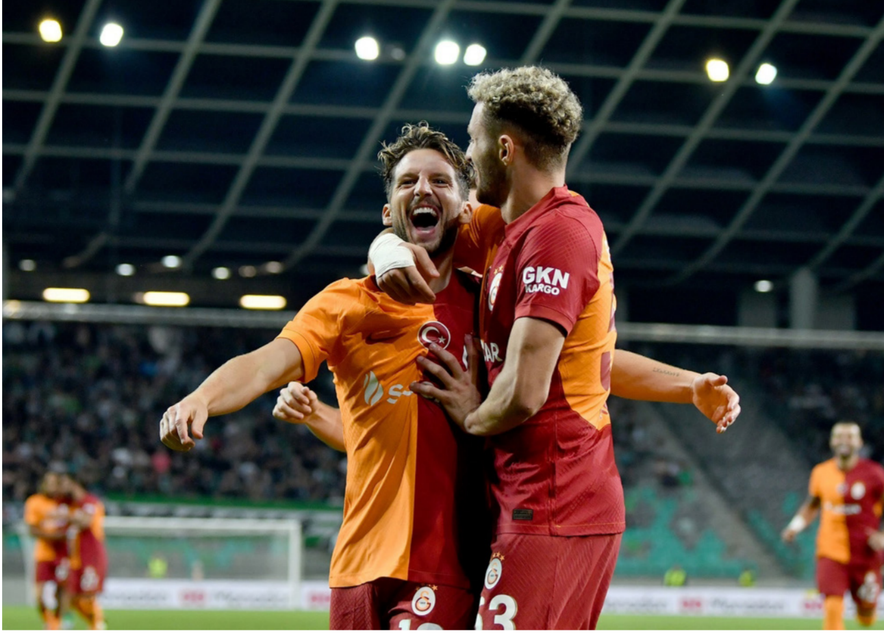
لاعبو غلطة سراي

رحيل جوسينس نهائياً إلى يونيون برلين. فلم يكن الرياضي بالتشكيل الأساسي للإنتر خلال الموسم الماضي. وهذا الصيف، دعم إنتر دفاعه بأفضل طريقة ممكنة. إذ تعاقد مع خوان كوادرادو وكارلوس أوجوستو على الطرفين بدلاً من بيلاونفا وجوسينس. كما ضم بيسنيك بقلب الدفاع. ويقترب النادي من الإعلان عن تعاقد مع بنيامين بافارد مدافع بايرن ميونخ، وفي الوسط، رحل مارسيلو بروزوفيتش صوب النصر السعودي. لكن النادي عوضه بضم نجم المستقبل الإيطالي دافيد فرانسيسي. الخط الهجومي كان أكثر خطوط الفريق تغييراً، حيث غادر الثلاثي دجيكو، لوكاكو وكوبوا، في حين بقي لاوتارو وحيداً، لكن النيرازوري تعاقد مع ماركوس تورام وماركو أرناوتوفيتش وأليكسيس سانشير. يعتبر إنتر المرشح الأبرز بالنسبة للأندية الإيطالية للوصول بعدد في دوري الأبطال في ظل القيادة الفنية المميزة للمدرب سيموني إنزاجي. بجانب إمكانات لاعبي الفريق والتفاهم الواضح بينهم، فيما لا يزال نابولي ولاسيو يفتقدان خبرة المواعيد ميلان في مرحلة الإحلال والتجديد.