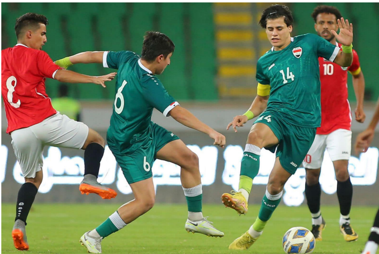
الأولمبي يختتم اليوم معسكره في البصرة ببقاء عمان

خضرت الأولمبي للمشاركة في تصفيات آسيا المؤهلة إلى النهائيات الآسيوية ثم الأولمبياد في باريس 2024. وسيلعب الأولمبي في تصفيات آسيا ضمن