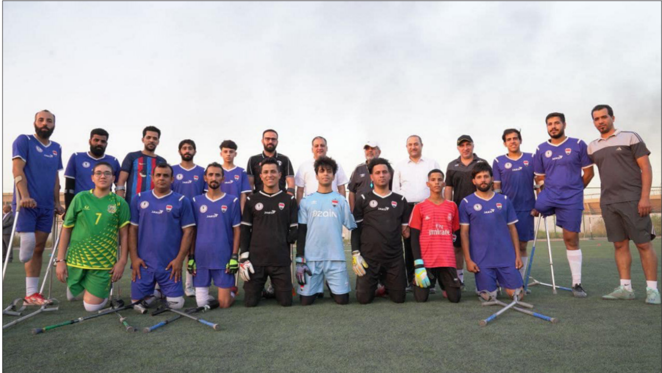
المبرقع يتوسط منتخب فاقدي الأطراف

الحكام، والمدربين، والخدمات الملحق الخاصة بالجمهور. وفي سياق آخر، اطلع وزير الشباب والرياضة السيد أحمد المبرقع، على أعمال التأهيل والصيانة التي يشهدها ملعب المدينة الدولي بسعة 32 ألف متفرج، إذ جُول السيد الوزير في الملاحظات الخاصة بعمليات التأهيل والصيانة، إلى جانب