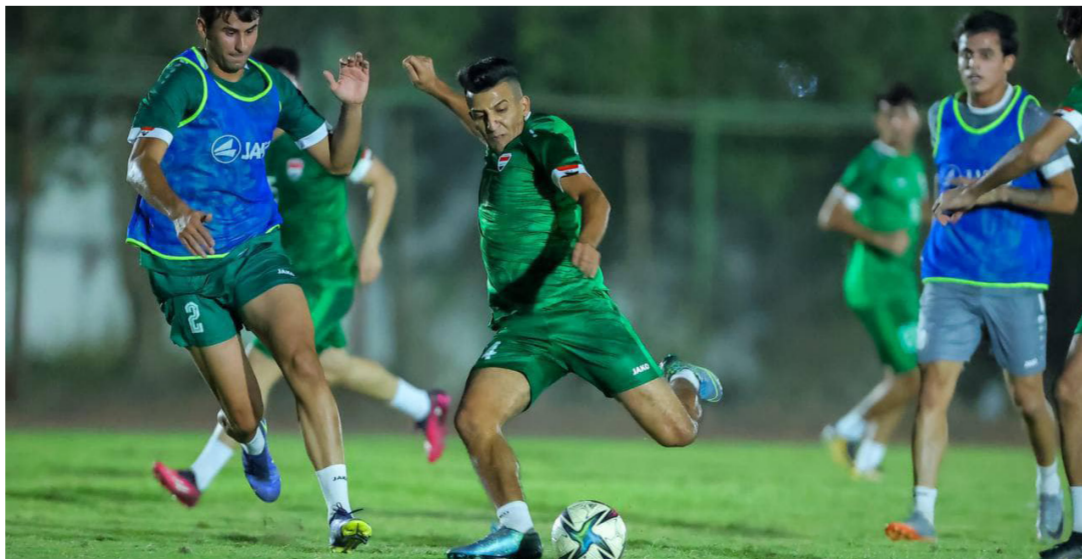
جانب من تدريبات منتخبنا الوطني لكرة القدم