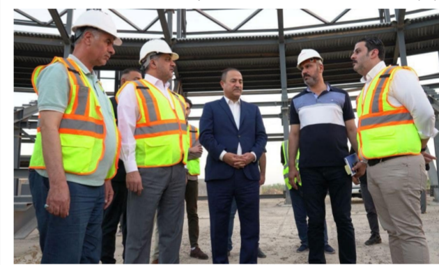
المبرقع خلال جولته التفقدية

أعلن وزير الشباب والرياضة أحمد المبرقع، عودة العمل في مشروع ملعب عمو بابا وقال بيسان للوزارة «إن المبرقع تفقد مشروع ملعب (عمو بابا) الأولمبي، برفقة مدير دائرة الشؤون الهندسية والفنية المهندس عبد الحالمخ الفعافج ومدير عام دائرة العلاقات والتعاون الدولي حسام حسن، واستمع إلى شرح مفصل عن محتويات الملعب الأولمبي، الذي يتسع ل 30 ألف متفرج، والمرافق الخاصة به، من ملعب مع مضمار لألعاب القوى سعة ألفي متفرج، وملعب تدريب سعة 500 متفرج وفتنق».