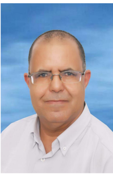
الناقد المغربي أحمد بلخيري