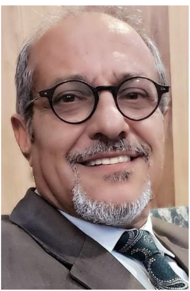
الروائي والشاعر علي لفته سعيد

كانت النهاية سعيدة مفتوحة على الأمل. الهوامش: 1 - علي لفته سعيد، المئذنة، تموز، دمشق، سورية، ط 1، 2011. أرقام الهوامش مطابقة لنسخة الإلكترونية PDF للنص الدرامي. 2 - ابن منظور، لسان العرب، دار صادر، ج 13، ص 132. 3 - المئذنة، ص 4، 4 - نفسه، ص 4، 5 - نفسه، ص 4. 6 - نفسه، ص 5، 7 - نفسه، ص 5، 8 - نفسه، ص 5. 9 - نفسه، ص 10، 5 - نفسه، ص 11-12. 12 - نفسه، ص 13، 7 - نفسه، ص 14، 12 - نفسه، ص 14. 15 - نفسه، ص 16، 16 - نفسه، ص 17، 15 - نفسه، ص 23. 18 - نفسه، ص 19، 13 - نفسه، ص 20، 32 - نفسه، ص 7. 21 - نفسه، ص 24، 22 - نفسه، ص 23، 24 - نفسه، ص 33. 24 - نفسه، ص 25، 10 - نفسه، ص 26، 28 - نفسه، ص 35. 27 - نفسه، ص 28، 35 - نفسه، ص 29، 35 - نفسه، ص 36. 30 - نفسه، ص 31، 36 - نفسه، ص 32، 36 - نفسه، ص 41. 33 - نفسه، ص 34، 36 - نفسه، ص 35، 37 - نفسه، ص 38. 36 - نفسه، ص 37، 43 - نفسه، ص 38، 37 - نفسه، ص 38. 39 - نفسه، ص 40، 48 - نفسه، ص 41، 48 - نفسه، ص 51. 42 - نفسه، ص 43، 49 - نفسه، ص 44، 51 - نفسه، ص 23. 45 - نفسه، ص 46، 47 - نفسه، ص 47، 47 - نفسه، ص 47. 48 - نفسه، ص 49، 14 - نفسه، ص 50، 40 - نفسه، ص 12. 51 - نفسه، ص 14، 52 - نفسه، ص 53، 14 - نفسه، ص 20. 54 - نفسه، ص 55، 26 - نفسه، ص 56، 45 - نفسه، ص 15. 57 - نفسه، ص 58، 18 - نفسه، ص 59، 25 - نفسه، ص 25. 60 - نفسه، ص 61، 28 - نفسه، ص 62، 40 - نفسه، ص 27. 63 - نفسه، ص 64، 40 - نفسه، ص 65، 21 - نفسه، ص 25. 66 - نفسه، ص 67، 44 - نفسه، ص 68، 45 - نفسه، ص 14. 69 - نفسه، ص 70، 45 - نفسه، ص 71، 9 - نفسه، ص 38. 72 - نفسه، ص 73، 44 - نفسه، ص 10. *ناقد مغربي