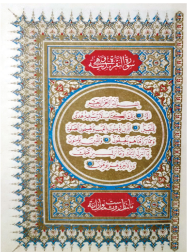
بداية سورة البقرة