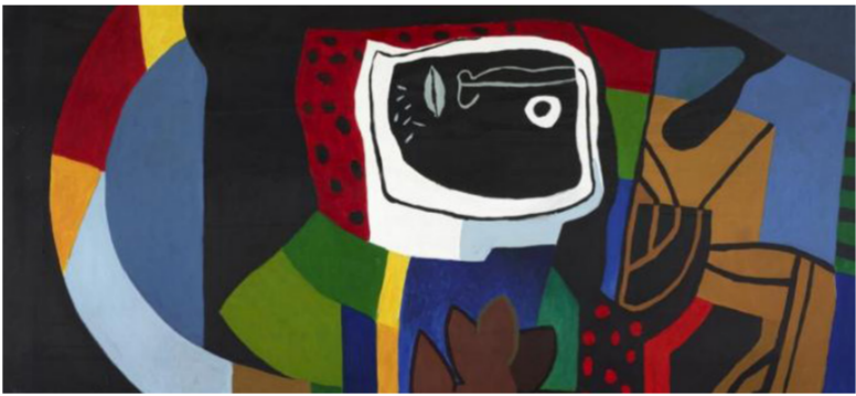
«الوجه الغريب» لضياء العزاوي

خدعت الجميع لا أحد يعرف بأنها هي السارقة « والنشالة» في هذا الشارع .. دخلت « صمود » السوق هذا اليوم مكرراً . أغلب المتقاعدين قد استلموا رواتبهم وأغلبهم كبار السنن ما يجعل سرقتهم سهله جدا . جالت في السوق حتى الساعة العاشرة صباحا . هي في اللعبة الجديدة أن تكون جميعا حامدين لا حدث. 60». وهو استغلال تكومي. لهذا خاف الشاب على المئذنة «من يستغلها ليعود بنا إلى هور الطاعة...»61، الطاعة البريرة بنينا