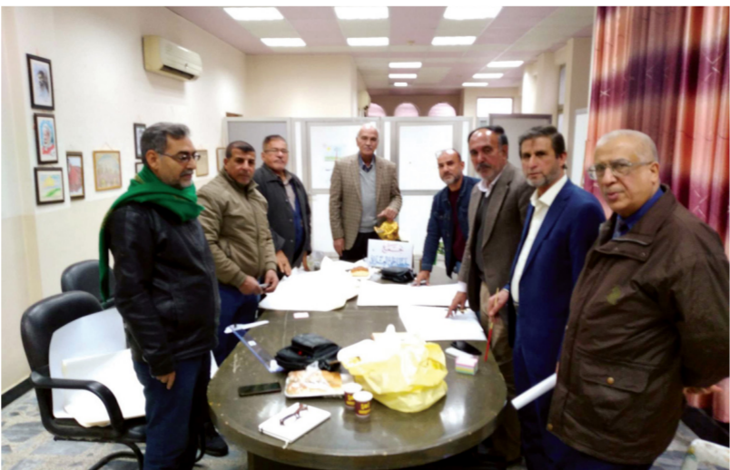
أول إجتماع تشاوري