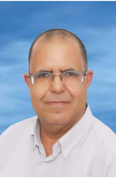
الناقد المغربي أحمد بلخيري