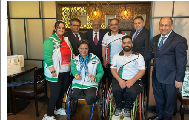
السفارة العراقية تحفي بوفد الطاولة البارالمبية

موظف من السفارة العراقية إلى مدينة أولسون ليتواجد مع الوفد طيلة فترة البطولة وكان إدارياً متميزاً بكل شيء. وقدم الكريدي شكره وتقديره للسفارة العراقية على حسن الضيافة وتكررها للوفد المشارك وما