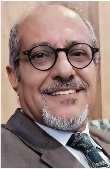
الروائي والشاعر علي لفته سعيد