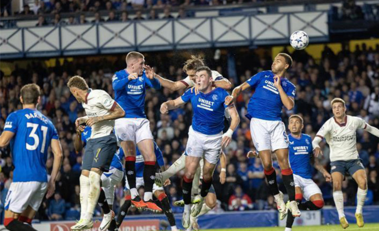
صراع على الكرة في مباراة رينجرز وأيندهوفن في أبطال أوروبا