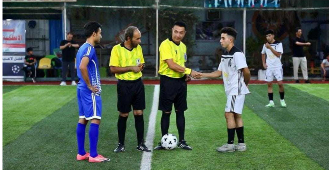
من اجواء بطولة السداسي لاندية بغداد

لاسيما وان إحادنا شارك في بطولة كأس العالم التي جرت في شهر أيار الماضي في تركيا وفق فيها المركز