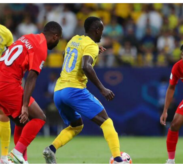
من مباراة النصر وشباب الأهلي

بنتيجة 2-4، والتأهل لدور المجموعات بدوري أبطال آسيا، مشيرا إلى ضرورة وجود تقنية الفار في تلك المباريات، وقال تاليسكا في المؤتمر الصحفي عقب مباراة شباب الأهلي: «خلفنا العديد من الفرض، وهناك أكثر من ركلة جزاء لنا ولكن الحكم لم يحتسبها وطالب باستمرار اللقب»، وقاطعه كاسترو ضاحكا، بقوله: