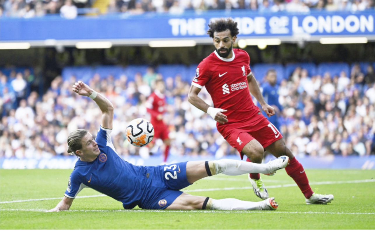
تعادل ليفربول وتشيلسي بهدف لثله في الدوري الإنجليزي

في حين استهل توتنهام مشواره بلا مهاجمه النجم هاري كين بعد انتقال الأخير إلى بايرن ميونخ الألماني بسقوفته في فخ التعادل أمام برنتفورد 2-2 على ملعب «جني نيك كومونيتي» وافتتح توتنهام ثامن الموسم النجمي التسجيل عبر الأرجنتيني كريستيان روميرو (11)، ثم عادل الكامرون التواصل الاجتماعي «نوتتر» «حسمت صفقة انتقال موييسيس كاسيدو من برايتون إلى تشيلسي، وتصل الطرفان إلى اتفاق نهائي، وستصبح رسوم الانتقال قياسية في إنجلترا»، وأضاف خبير الميركاتو: «حسمت الصفقة مقابل 115