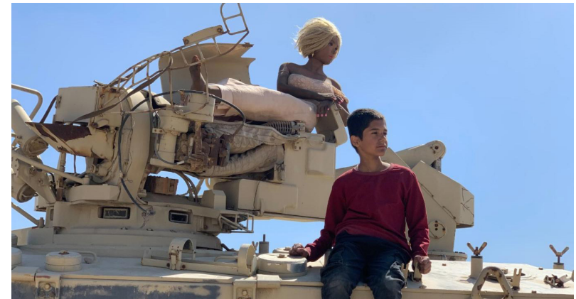
فلم «جنائن معلقة»