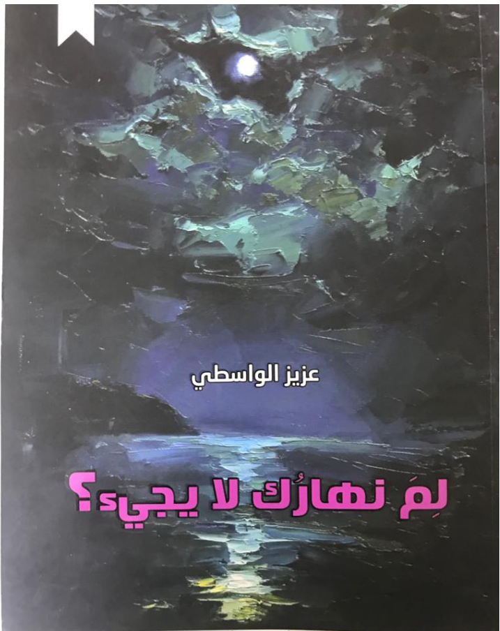
غلاف المجموعة الشعرية

وبذلك قدم المنتج(الشاعر) نصوصا تعتمد السرد الشعري المتكز على الفصل الدرامي الذي يأخذ ابعادا نفسية واجتماعية.. فضلا عن تميزها بجمليها المكثفة.. الموجزة.. المركزة على الفكرة باعتماد البناء المشهدي القائم على جمل قصيرة موسومة بالحركة.