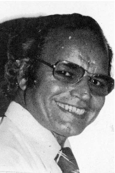
الفنان المعتبر حسن بغدادي تولد 1934

تناول فيها أغلب الموضوعات الإنبطاعية والواقعية: كالصحراء والبادوة وما فيها من بيوت الشعر والجمال والراعي والأغنام. والبيئة البغدادية وشوارعها وأزقتها وحرفها الشعبية المتميزة. ونهر دجلة وسمائه وقواربه البسيطة. ومناظر الغروب والشرق في القرى والأرياف.. إلخ.