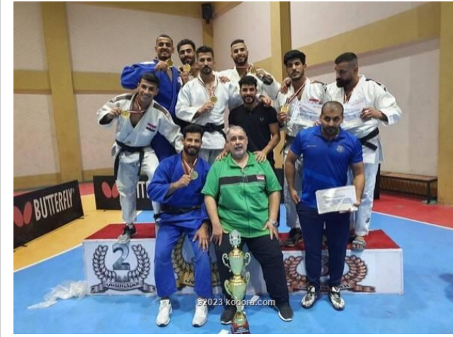
جانب من التتويج

عاشقاً هذا النادي، ولا بد أن ننهي على عمل الهيئة الإدارية، لولاكبتها ودعمها لنا خلال هذه الفترة».