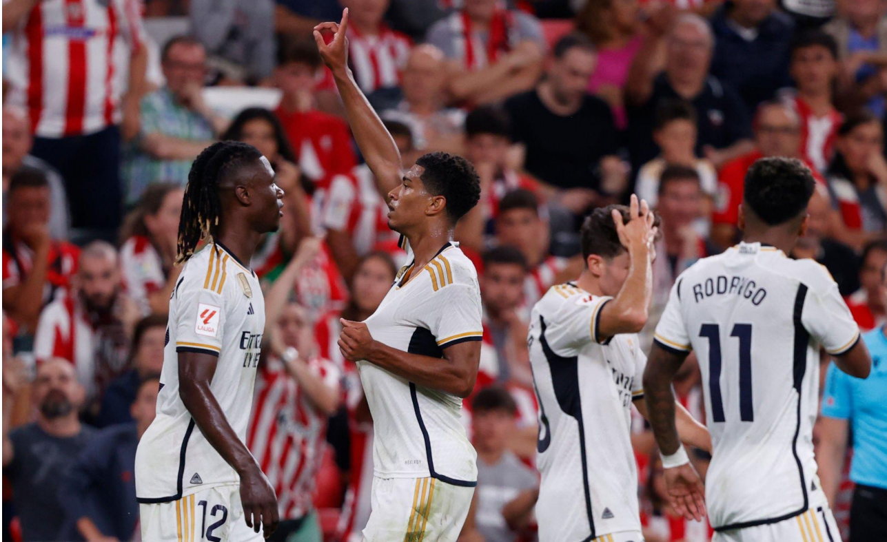
فرحة لاعبي ريال مدريد بالفوز

وفي جانب آخر أجنبط باريس سان جيرمان جماهيره بتعادل سلبي أمام ضيفه لوريان، أول أمس، في الجولة الأولى من الدوري الفرنسي.. اكتفى حامل اللقب بنقطة على ملعبه ووسط جماهيره، في أول ظهور رسمي لدره الجديد لويس إنريكي، الذي بدأ عليه الحرج أمام الأتصار في مدرجات حديقة الأمراء.