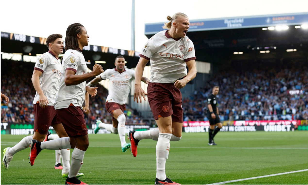
هالاند يبدأ الدوري الإنجليزي يهدفين في شباك بيرنلي

وقبل دقيقة واحدة على انتهاء الوقت الأصلي للمباراة، حسم لاعب الوسط الشاب جافي جيرا، النقاط الثلاثة لصالح الضيوف. بهذه النتيجة، نجح فالنسيا في حصد 3 نقاط ثمينة، خارج الديار في أول مباراة بالموسم الجديد. ليحتل الوصافة بفارق الأهداف، خلف رايو فايكانو، الذي افتتح الموسم بالفوز على مضيفه أليريا (0-2) قبل ساعات في المقابل. ويقع إشبيلية، بعد هذه الخسارة على أرضه، في المركز قبل الأخير، قبل ألبيرتا في جدول الدوري المحلي. يذكر أن إشبيلية سيواجه مانشستر سيتي، يوم الأربعاء المقبل على كأس السوبر الأوروبي.