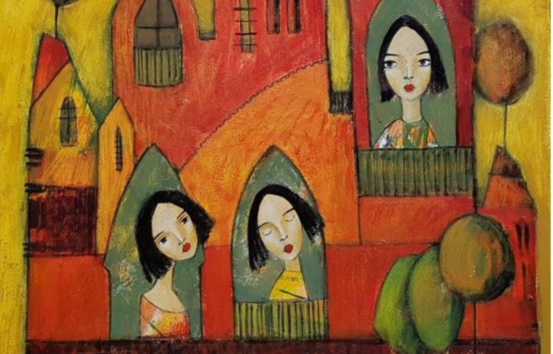
العائلة» للفنانة الأرمينية أنا سوجومونيان

بضعك الأرق أمام معضلة اختيار؛ هل تتنازل عن حاجتك للراحة وتسلم نفسك لليقظة المهتاجة. أم تحاول إخمادها وتتابع محاولة استجلاب الغفوة من أعماق روحك؟ لا تعرف أيّ الطريقين سيطيّب