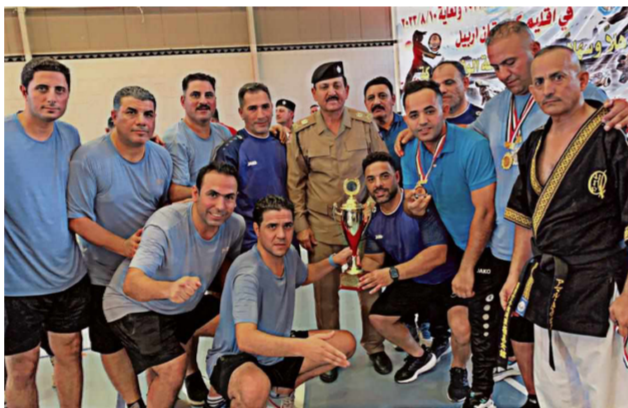
فريق مديرية الجنسية العامة بطل كأس الوزير بالباغوت