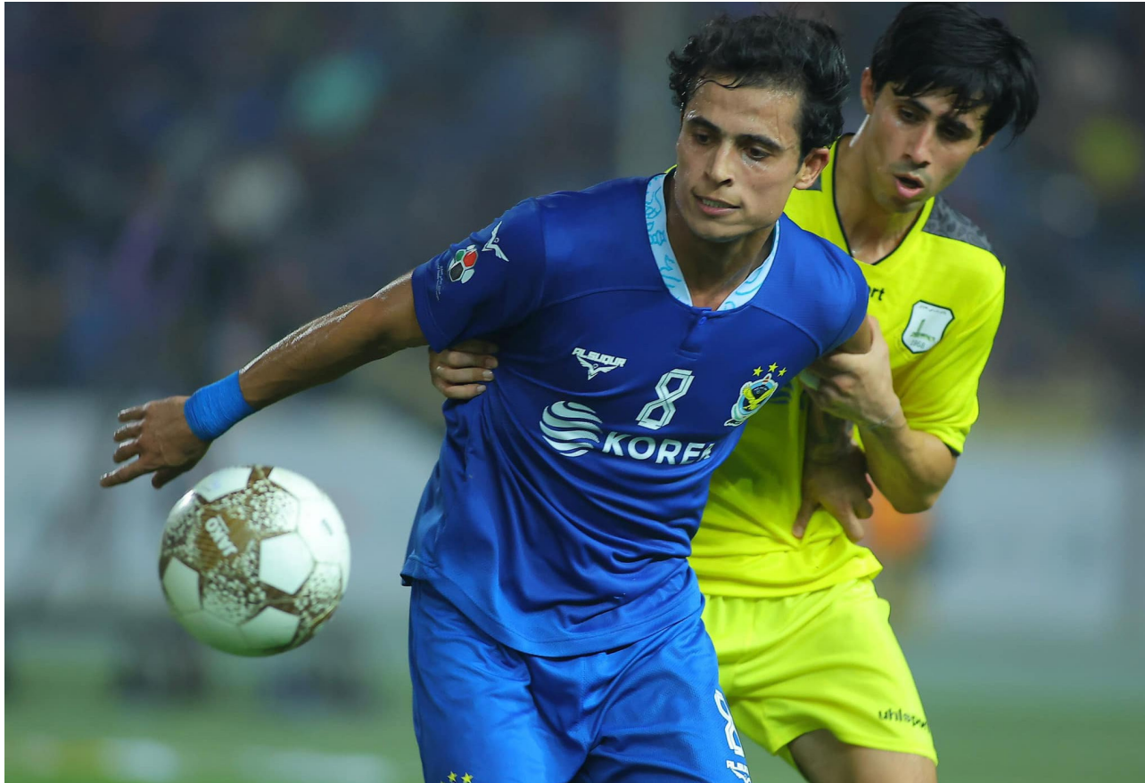
صراع على الكرة في نهائي الكأس

لبطولة كأس الملك سلمان للنادية العربية لعام 2023. وقال رئيس الاتحاد العراقي لكرة القدم، إن بلوغ ممثل الوطن واللاعبين الذين نجحوا في تحوّل تراجعهم إلى انتصار كبير الذي