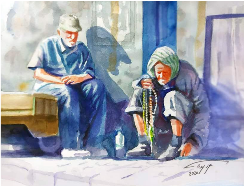
من أعمال الفنان

ينجذب دائما الى الانطباعية بأسلوبه المائي فهو مكثنز بكثير من الخبرة والتعامل مع هذا النوع من الرسم. كثير من فناني العراق بلغ بهم اللون المائي الى حد التنافس العالمي كثير منهم برعوا بشكل كبير وكانت رسوماتهم سطوة على غير المتوقع .. منذ تأسيس جماعة بغداد والرواد عمل الكثير من فناني العراق اشتغالات بأسلوب المائي. منهم فائق حسن وحافظ الدروبي وغيرهم .. ومن ثم جاء فيصل العبيبي وصلاح جباد حتى تولدت سلالة الاسلوب المائي وصولا الى هذا اليوم .. وهنا نتوقف عند الفنان جبار مهدي الذي شارك في مجمل المعارض التي اقيمت في كاليبرهات بغداد المعروفة والتي بدأت تتكاثر هذه السنوات