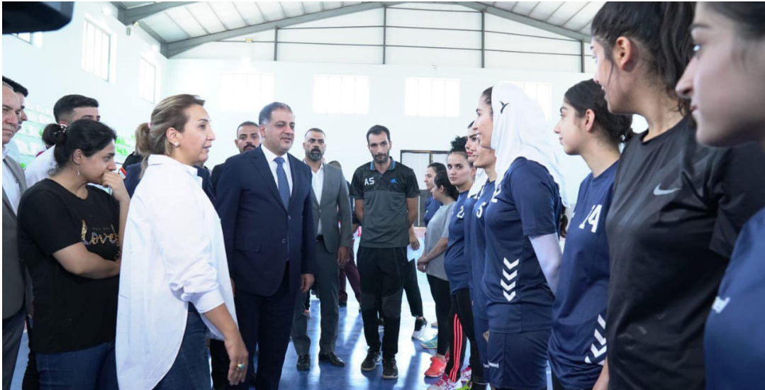
المبرقع يوجه بدعم فريق المحافظة النسوي بكرة اليد

واضفت حميد ان العمل التدريبي في الياات الجودة هو عمل اختصاصي دقيق وان التدريبات العملية هي من اهم وسائل الصقل وتراكم الخبرات وخصيتها بكل ما هو جديد ويعزز مادة الدرس لدى الطلبة، مشيرة ان تفاعل الطلبة وانسجامهم مع مفردات البرنامج كانت عند مستوى