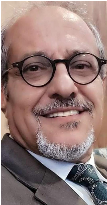
الروائي والشاعر علي لفته سعيد

مختلفة أبرزها الموت- الحياة كمحرّكٍ تفاعلي بينهم ينشأ معهم كطريقةٍ تعبير فاضحة ومتوحّشة. لنعتمد كل شخصية على فاصل دقيق تقيس إيقاعها الداخلي ضدّ الفاصل المتقابل لها. لنرى هذا الكم الموهول من الصراعات بينهم.