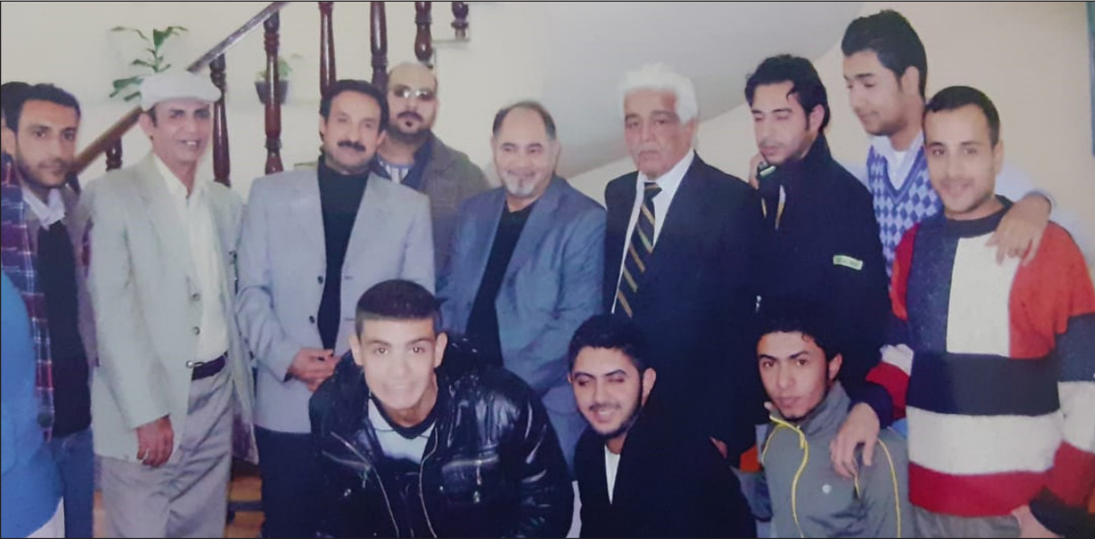
الراحل يتوسط كادر الجريدة

ولم يقل الراحل الحاضر في إرث تأريخه الصحافي والنضالي. وحضوره الفاعل في الكثير من الفعاليات والأنشطة التي تدعم مشروع بناء اعلام عراقي حر ومستقل. مثلما كان يدعم مشروع بناء دولة مدنية حرة معاصرة.