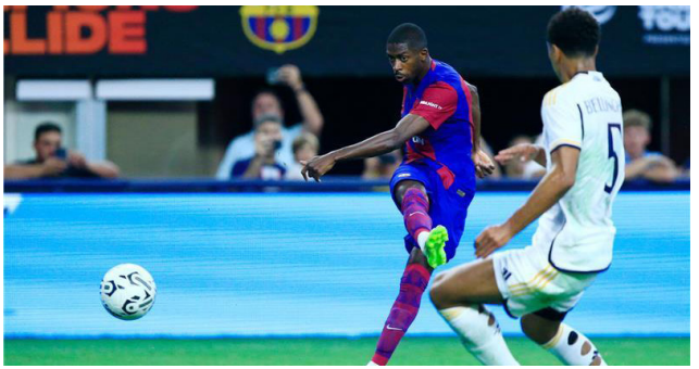
من لقاء برشلونه وريال مدريد

أحرز الهولندي ماكس فيرستابن، سائق ريد بول، المركز الأول خلال سباق السرعة على هامش سباق جائزة بلجيكا الكبرى، ضمن بطولة العالم لفورمولا 1، وتفوق فيرستابن، بطل العالم في الموسم الأخيرين، على أوسكار بياستري سائق مكلارين بفارق 0,011 ثانية، مسجلا أسرع لفة في دقيقة واحدة و49,056 ثانية، على مضمار سبا فرانكورشان البالغ طوله 7,004 كم، وجاء ثاني فريق فراري المكون من كارلوس ساينز وتشارلز لوكلي، في المركزين الثالث والرابع، وتأخر سباق السرعة بحوالي 35 دقيقة، بسبب الأمطار الغزيرة، وجرى رفع العلم الأحمر خلال الجزء الثاني من سباق السرعة، بعد اصطدام لانس سترول سائق أستون مارتين بالواجز، حيث دفع ثمن الاستعانة بالإطارات الجافة على مضمار ليس جافا بشكل كامل، وهو نفس الأمر الذي أدى