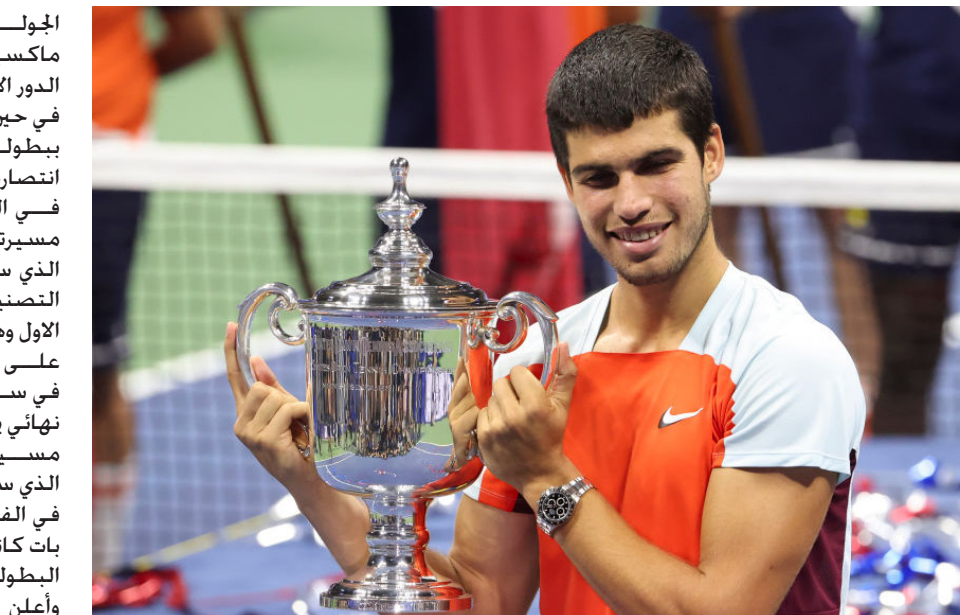
الإسباني كارلوس ألكاراز

الجولة، إلى أن تغلب على الأمريكي ماكسيم كريسبي حامل اللقب في الدور الأول. في حين، فاز الأرجنتيني بدرو كانتشين ببطولة جشناد السويسرية بعد انتصاره على الإسباني ألبرت راموس في النهائي ليتوج بأول لقب في مسيرته الاحترافية، واستطاع كانتشين، الذي سيرتقي إلى المركز 49 في التصنيف العالمي للتنس الصغار أمس الأول وهو أفضل مركز له، أن يتغلب على راموس بنتيجة 3-6 و 6-0 و 5-7 في ساعتين و25 دقيقة، وكان هذا أول نهائي يخوضه كانتشين (28 عاما) في مسيرته، وفي المقابل فشل راموس، الذي سبق وتوج بجشناد في عام 2019 في الفوز بخامس لقب بمشواره، وبفوزه بات كانتشين أول أرجنتيني يتوج بهذه البطولة في آخر 16 عاما.