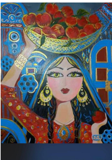
من أعمال الفنانة

مسافة تفصل بين التشكيليين العرب وأقرانهم من فنانى العالم. ربما تكون بسبب عدم توفر الأدوات والمستلزمات الفنية. وحاجة الفنان التشكيلي العربي للدعم