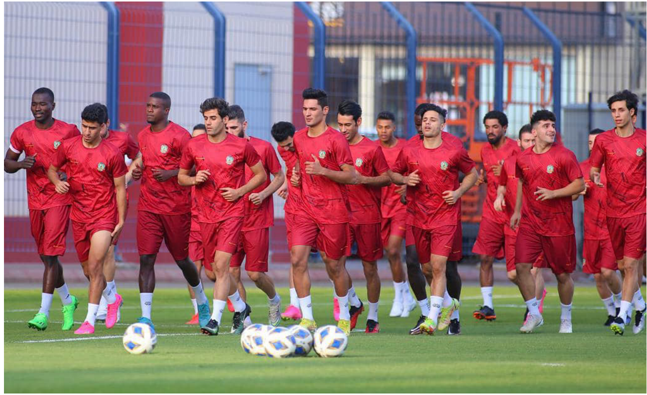
تدريبات الشرطة استعدادا للبطولة العربية