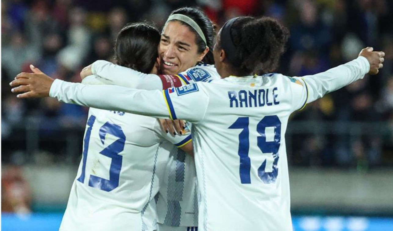
لاعبات الفلبين يحتفلن بالفوز

المليون لكأس العالم للسيدات لعام 2023 وشاهدت مباراة ضمن منافسات المجموعة الرابعة بين إيطاليا والأرجنتين في استاد إين بارك في أوكلاند، وأضاف «تم توجيه الدعوة لتلك الأسرة لمقابلة رئيس فيفا جيانى إنفانتينو الذي قدم لهم فرصة حضور جميع المباريات المتبقية بالبطولة على ملعب أوكلاند». وصرح إنفانتينو بأنه شرف كبير الاحتفال مع تلك العائلة بعد كسر ذلك الرقم التاريخي من مبيعات التذاكر. وتابع «يعتبر هذا أحدث إنجازات البطولة التي وصلت بالفعل للعديد من الإنجازات وكسرت العديد من الأرقام القياسية. سواء على المستوى العالمي أو في الدولتين المضيفتين بعد بيع 1.5 مليون تذكرة حتى الآن. تم تجاوز هدف المبيعات خلال 5 أيام فقط من بداية البطولة. وبالتالي فإن هذه النتائج على وشك أن تكون أكثر بطولة للسيدات من حيث عدد الحضور في التاريخ. حيث عدد الحضور الرقم القياسي السابق الذي كان خمله نسخة كأس العالم للسيدات فيفا 2015 التي أقيمت في كندا». وأوضح: «شهدت مباريات الافتتاح أيضاً حضوراً قياسيًّا لمباراة كرة القدم للسيدات تقام حالياً بإستراليا ونيوزيلاندا وتستمر حتى 20 آب المقبل. وذكر فيفا عبر موقعه الرسمي اليوم الإثنين: «قامت عائلة حضور 42 ألف. 137 مشجعا مباراة نيوزيلاندا ضد النرويج».