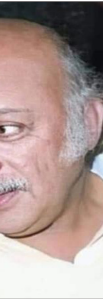
مظفر النواب (1934 - 2022)

أنقُف مع تجربته في الشعر الحكيم باللهجة العراقية، لاعتقادي أنّه الأكثر