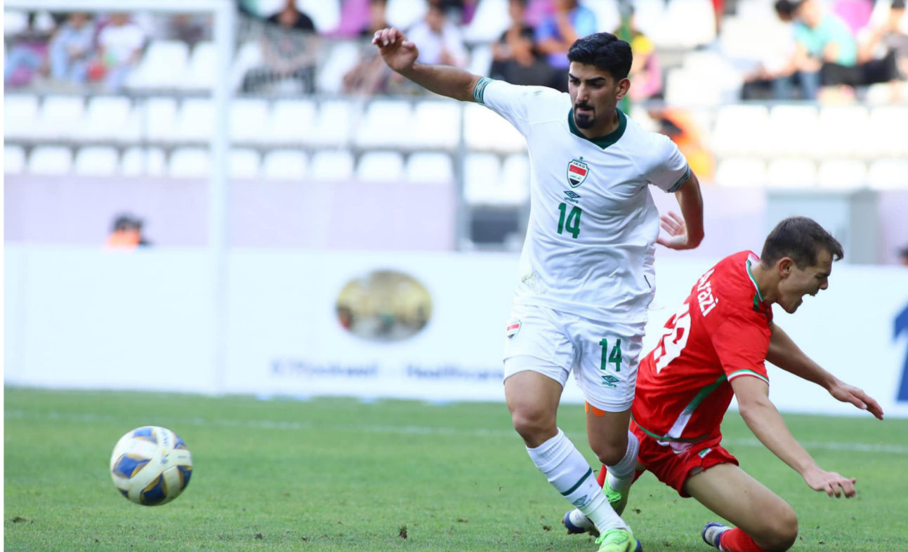
الأولمبي في لقاء سابق