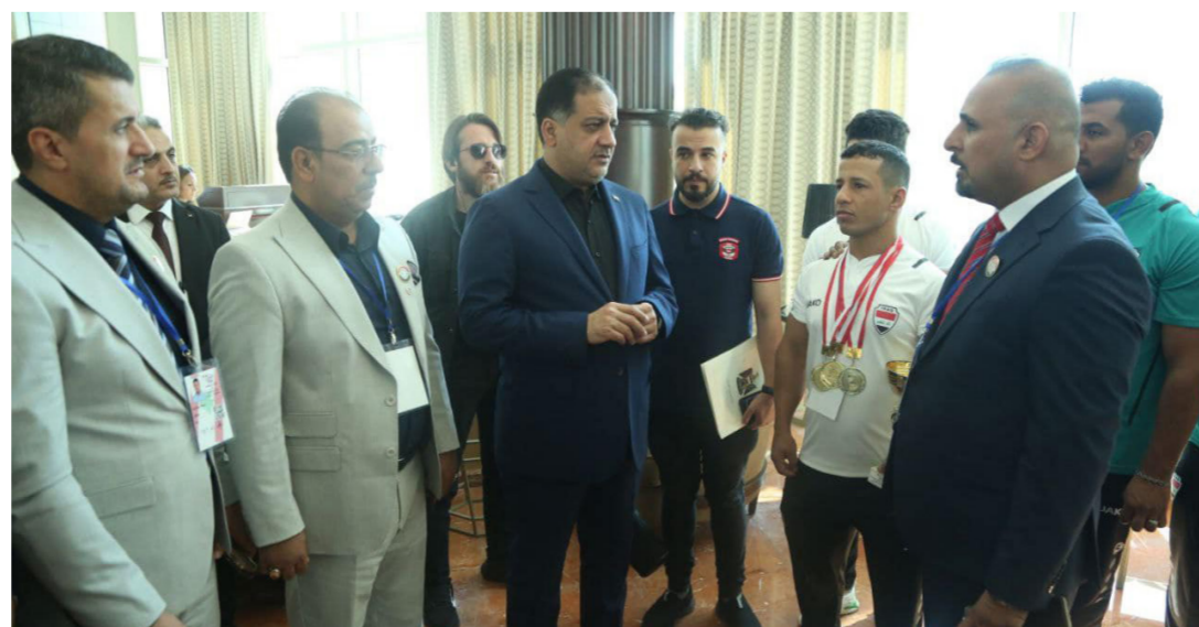
المبرقع يثمن إنجازات القوة البدنية

الآخرة جملها للذين لا يريدون علواً في الأرض ولا فساداً والعاقبة