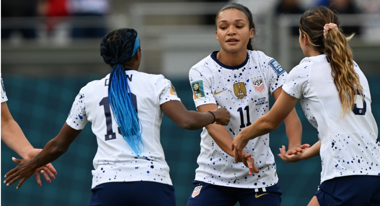
لاعبات المنتخب الأمريكي بكرة القدم

وتلقى اللاعبات الجامايكيات اللواتي سنبدان منشورهن في كأس العالم القادمة في أستراليا ونيوزيلندا اليوم الأحد في سيدني ضد منتخب فرنسا. باللوم على الأخاد الحلي للعبة بسبب عدم إقامة مباريات دولية ودية قبل البطولة. وخاض المنتخب الجامايكي معسكراً في أمستردام للتحضير لمشاركته الثانية تواليًا في كأس العالم. إلا أنه لم يتمكن من خوض مباراة خضيرية حتى وصوله إلى ملبورن. حيث فاز على المغرب (0-1) في 16 تموز. وقالت المدربة لورن دونالدسون لقناة «سبورتنز ماكس» الكاريبية: «المعسكر كان جيداً. كنت أرغب في خوض مباراة كي تكون اختباراً حقيقياً لكنه كان جيداً على الرغم من كل شيء». كما تبدي اللاعبات عدم رضاهن عن التأخير في دفع مكافآت المباريات. ما دفعهن لإصدار بيان الشهر الماضي يطالبن فيه بإجراء تغييرات من الأخاد. وأعربن في السياق نفسه عن أسفهن «في الأشهر الأخيرة بسبب الفوضى الشديدة. فقدنا العديد من المباريات الودية. وهذا سيؤثر حتماً على استعدادنا للمباريات في أستراليا». قبل المواجهة الودية الأخيرة ضد المغرب. تعود آخر مباراة للمنتخب الجامايكي إلى نيسان/أبريل الماضي. ضد شيفيلد يونايتد. أحد الأندية المستوى الثاني الإنجليزي.