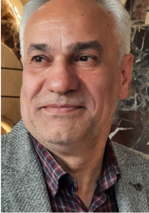
الشاعر نصير الشيخ

الرجسية العاقبة الأثر، وأثر جسيب روابطها النصية الفاعلية مع بؤرة الحدث الواقعية بشكل نثري متنوع محبب أظهر القيمة الجمالية الشعرية والفنية لوقع سجر تلك المدلولات اللفظية البيانية التي نسيحت بها صياغة التركيبات الجمالية الخيرة المتناجبة بالنحو الآتي: (نهار اللصوص، عسس الليل، منافي الجليد، منافض الغبار، سنين الرما، تزوم الجسد)، فضلاً عن الأثر الدلالي اللغوي الكبير لفعلية المشاركة الحركية (تشعلين، وخرقن اللذين جعلنا من حركة ثيمة القصيدة غنية بشعريتها الثرية وبدفنها الشعوري العاطفي الحميم.