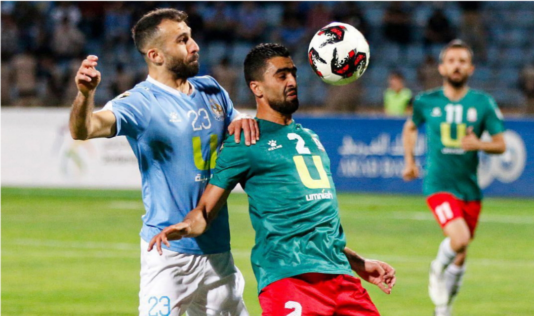
الفيصلي والوحدات في لقاء سابق

وتبدو الأفضلية تميل لصالح الكتبية الزرقاء، حيث توج الفيصلي بلقب الدر، وهذا كاف ليثبت مقدار جاهزيته بعدما تفوق على الوحدات بهذه البطولة وفاز عليه (0-1)... ورغم هذه الأفضلية، تبقى مواجهات الفيصلي والوحدات لا تخضع للمنطق، وليس شرطاً أن يفوز الطرف الأفضل، لأن جزئيات بسيطة قد تكون سبباً في حسم اللقب.