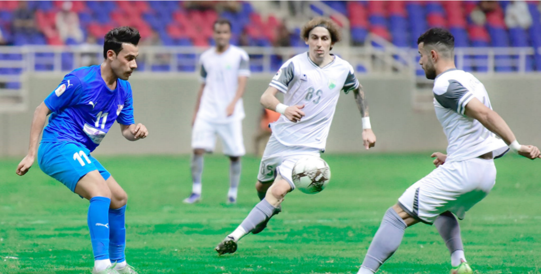
جانب من دربي الفرات الاوسط بين النجم ونقط الوسط

نقطة الى رصيدهما. ورفع الطلبة رصيده الى النقطة 60 حافظ فيها على مركزه الرابع. وبنفس الطريقة رفع زاخو رصيده الى 41 نقطة في المركز 14. كربلاء يعزز نتائجه الايجابية وتبادل فريقا نبط ميسان وضيفه دهوك ايجابياً بهدف لكل منهما. في المباراة التي جرت على ملعب ميسان وبهذا التعادل أضاف كل منهما نقطة الى رصيده. ورفع