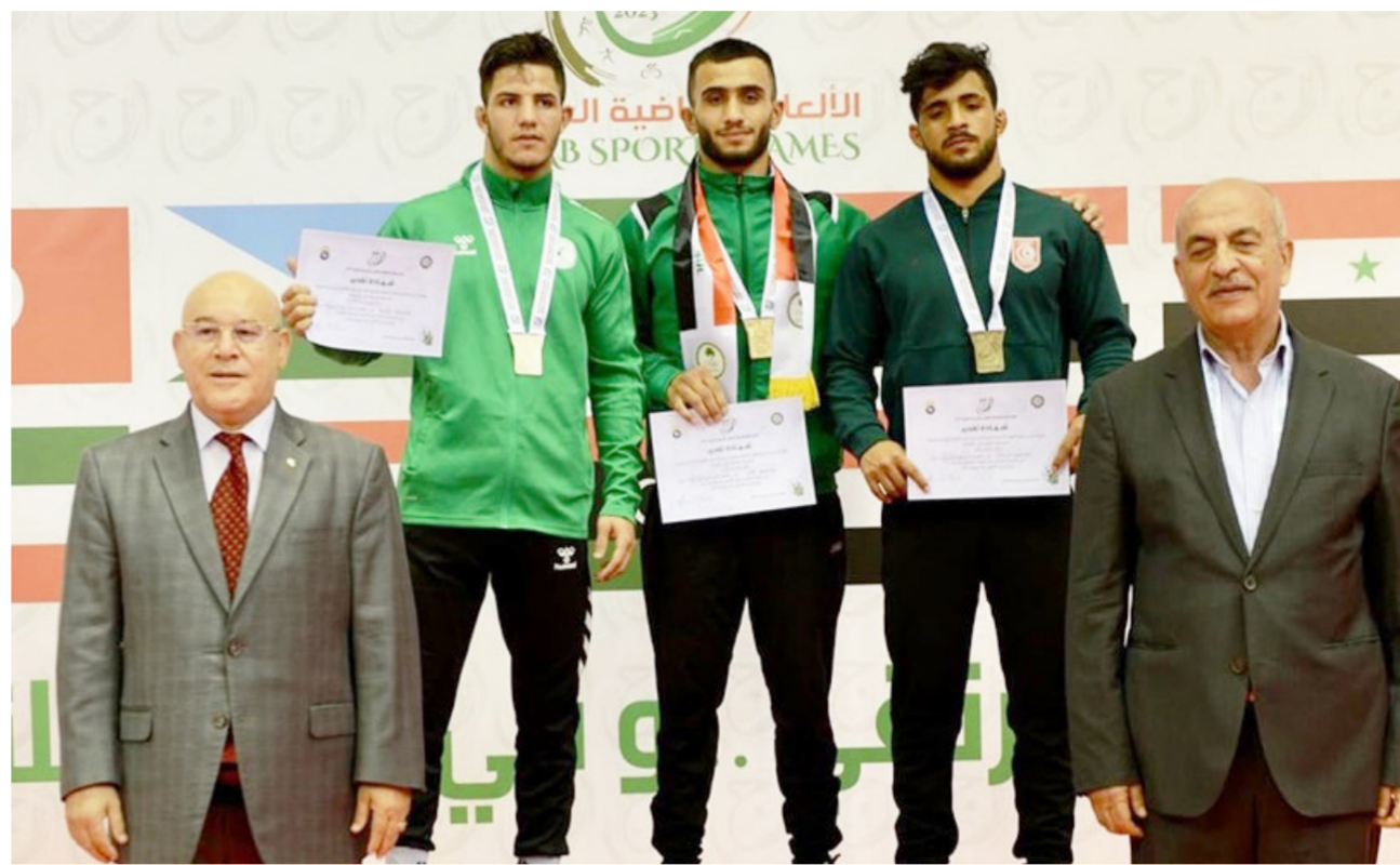
ابطال المصارعة على منصات التتويج