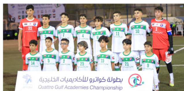
بدء بطولة كواترو للاكاديميات

استمتع الجمهور بالاداء الفني للفرق وظهر حارس الانبار بمستوى جميل وانقذ الرمي من كرات خطيرة كثيرة هذه البطولة السادسة وانشاد المختصين بشؤون كرة القدم بالتنظيم الرائع للبطولة وفق اجواء احترافية حيث حكام اللعبة ومعلقين واعلاميين ورجال التنظيم بدرجة تستحق الاشادة والتقدير ويقف وراء كل هذه النجاحات الاستاذ عبد العزيز عبد الله الذي يتابع الصغيرة والكبيرة من اجل نجاح هذا التجمع الخليجي الذي اشتهر بخليجي 25 والتي جرت احداثه في البصرة شكر لارعاة البطولة وشكرا للجان التنظيم وشكرا للفرق المشاركة.