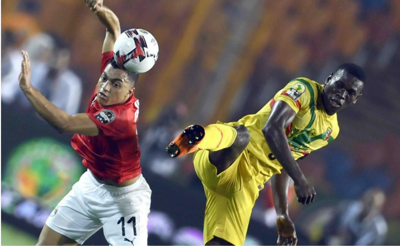
تصفيات أم أفريقيا ارشيف

السادس (الأخير) منتخبات ليسوتو وجنوب السودان وموريشيوس وتشاد وساو تومي وبرنسيب وجيبوتي وسيشيل وأريتريا والصومال وكششف دور المجموعات. ولقاءات ملحق منتخبات كاف، وكذلك مباراة الملحق العالمي. حيث ستكون على النحو التالي: الجولتان الأولى والثانية في المدة من 13 إلى 21 تشرين الثاني 2024. الجولتان الثالثة والرابعة في المدة من 3 إلى 11 حزيران 2024. الجولتان الخامسة والسادسة في المدة من 17 إلى 25 آذار 2025. الجولتان السابعة والثامنة في المدة من 1 إلى 9 أيلول 2025. الجولتان التاسعة والعاشر في المدة من 6 إلى 14 تشرين الأول 2025. دورة ملحق منتخبات كاف في المدة من 10 إلى 18 تشرين الثاني 2025. مباراة ملحق فيفا في آذار 2026.