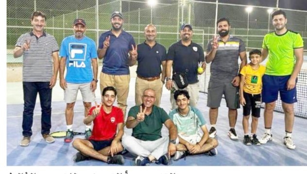
التنس يبدأ التحضير للتجمع الثالث

و نادي امانة بغداد ونادي النجدة ونادي كربلاء ونادي سنحارب ونادي السلمانية ونادي الموصل ونادي الفتوة ونادي كوسنجر .. واعرب امين سر الاتحاد الدكتور فؤاد حميد عن مساعده بوصول الدوري الى المباريات