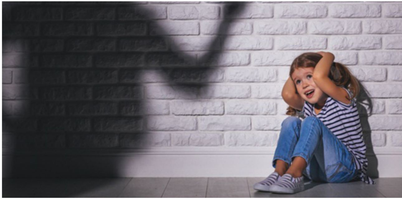
بغداد - زينب الحسني:

ليس بالغيريب أن يمر الطفل المعرض للعنف الأسري بحالات من الصدمة النفسية والعاطفية في بيئة عنيفة وملينة بالشكوك خاصة إن كان يرى نماذج للعنف أمامه كتعريض أمه للعنف أو التهديد أو الإيذاء بأي شكل وكيفية استجابة الأم لذلك الأذى. فقد أثبتت بعض الأبحاث التي أجريت أن نحو 90% من الأطفال الذين واجهوا العنف في منازلهم شهدوا حالات تعريض أمهاتهم للعنف أيضا، ما أثر عليهم بشدة وانعكس على سلوكهم من جميع النواحي.