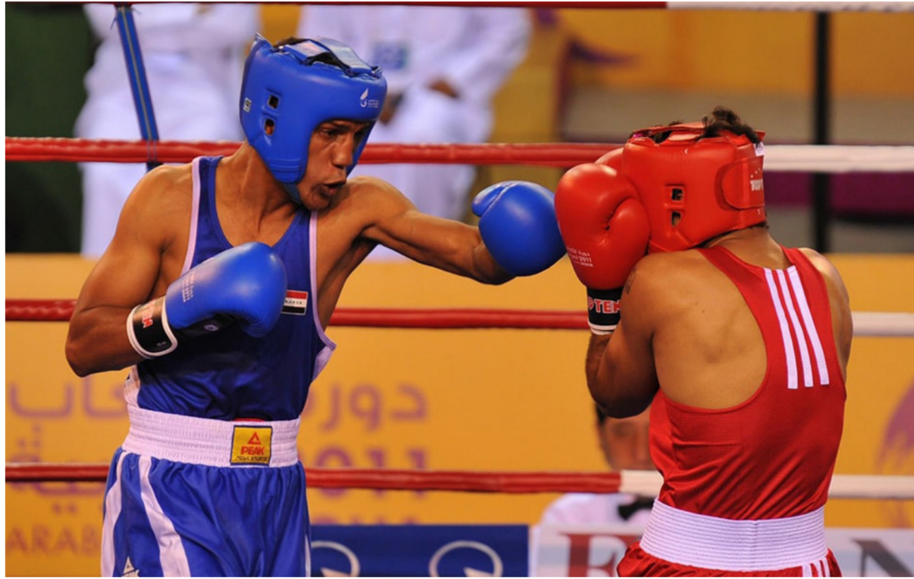
الملكة تتربح المشاركة في الدورة العربية

عن انفسهم باكثر من فعالية ويتنافس مهم سيجمع اكبر ابطال العرب من الغرب العربي والخليج بفعاليات متنوعة تنوعت عن تنهاوي فيها العديد من الارقام القياسية السابقة.