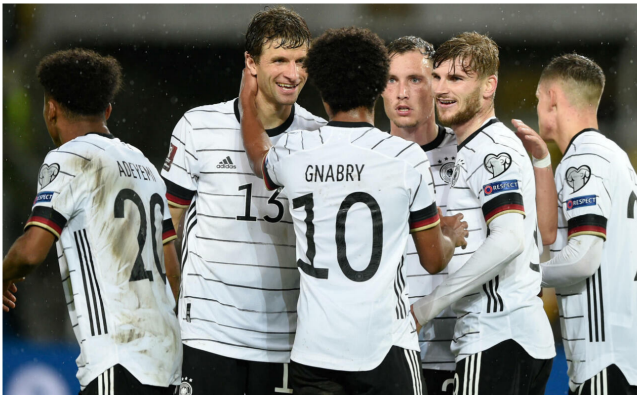
ألمانيا تضيف يورو 2024

واختتم: «تهدف التهمة لدعم المبادرات والشراكات، بالإضافة إلى إلهام الأطفال في جميع أنحاء أوروبا لممارسة النشاط البدني وتشجيعهم على تطوير حبهم لكرة القدم وقيمها».