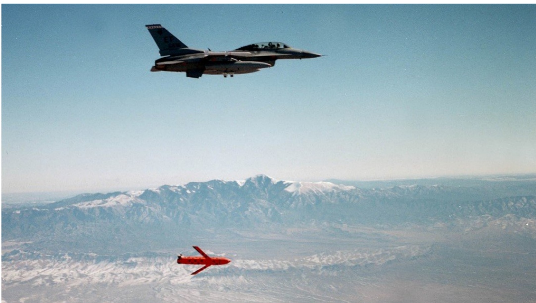
أداء للتخفي. المميزات التقنية يستطيع الطيران من خلال الحوذة حيث صمم شكلها الخارجي ومنصات الأسلحة والوقود وأجهزة الاستشعار المدمجة لتحقيق أقصى العدو قبل وقت طويل من رصدها.

نظرياً يمكن للطائرة مقاتلة أهداف جوية وبرية عدة في نفس الوقت، كما يمكنها شن "حرب إلكترونية" للتشويش على رادارات الأعداء وشمل اتصالاتهم إلى جانب التقاط بيانات ساحية المعركة ونقلها إلى مراكز القيادة. يتمحرك محرك الطائرة المتطور مسافة خليق أطول بـ30 بالمئة مقارنة بالمتحارب السابقة، كما إنها تملك نظام أسلحة من الجيل الخامس JASSM القادر على ختم الأهداف بدقة من مسافات كبيرة جعل الطائرة أمنة ضد نظم الدفاع الجوي. وتوصف شركة لوكهيد مارتن النظام بأنه "أول صواريخ كروز" المحمولة جواً التي صنعتها.