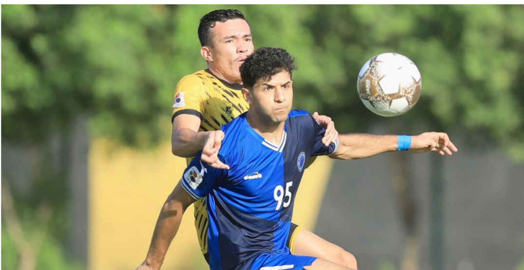
لقطة من دوري الكرة الممتاز