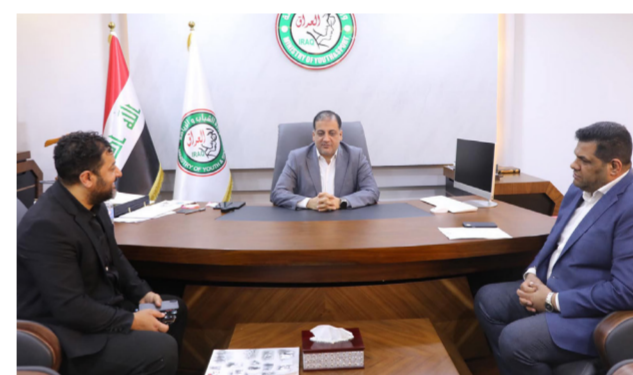
المبرقع يبحث دعم اتحاد غربي آسيا بالمبارزة

تتنظر منتخبات المبارزة بالفئات العمرية كافة على مختلف الصعد العربية والقارية والدولية».