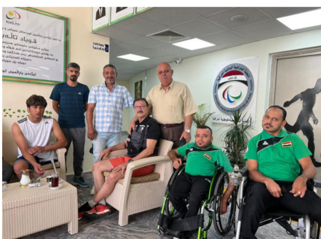
من فحوصات لاعبي السباحة البارالمبية

على اللاعبين المصابين في معسكر التدريب التدريبي المقام حالياً في السلبيانية استعداداً للمشاركة في دورة الألعاب الآسيوية المقرر اقامتها في شهر تشرين الأول عام 2023 وقال فوز ان الدكتور شخص العلاج للاعبين وبإشراف الشيخ محمد عضو اللجنة الفرعية في السلبيانية.