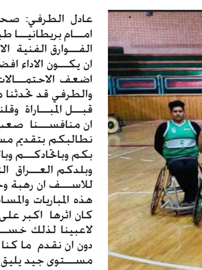
لاعبو منتخبنا بسلة الكراسي

بغداد - الصباح الجديد: حضر ثقة اللاعبين بانفسهم وقدرتهم على مواجهة الفرق الأخرى بالقارة الصفراء. لذلك فان نتيجة التعادل التي حُقت أمام المنتخب العراقي البلد المضيف تعد نقطة إيجابية في بداية المشوار. يؤكد على قدرتنا في الوصول إلى مراكز متقدمة في غرب اسيا. وفي ختام حديثه أشاد أبو زرع بالمنتخب الأولمبي العراقي حيث قال انه يضم مجموعة متميزة من اللاعبين الذين يمتلكون قدرات فنية