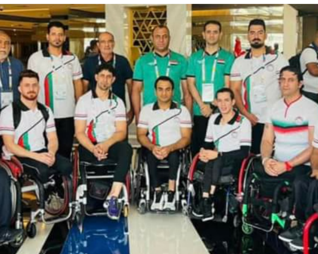
منتخب سلة الكراسي

بعد المباراة... اعتقد ان الفارق الفني لمنافسنا قد بدا واضحا منذ الدقائق الأولى للمباراة بعد ان احكم لاعبو قضيتهم على اجواء المواجهة على العكس من لاعبينا الشباب الذي لم يكن ادائهم موقفا طيلة وقت الاشواط الاربعة نتيجة قلة خبرتهم في مثل هذه المشاركات العالمية... واصف حاكي ارى بان النتيجة مقبولة جدا ففي ظل الفوارق الفنية التي يتمتع لاعبو المنتخب البريطاني فضلا على خبرتهم الكبيرة في مثل هذه الاستحقاقات العالمية... وانهي حاكي قوله... لا يخفى على احد ان اعدادنا لم يكن بالمستوى المطلوب ونحن جئنا لغرض