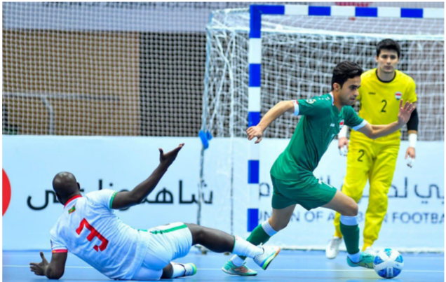
لقطة من مباراة وطني الصالات

إلى الدور ربع النهائي لبطولة كأس العرب لكرة الصالات، حيث تأهلت منتخبات ليبيا والجزائر والسعودية عن المجموعة الأولى، والمغرب والكويت ولبنان عن المجموعة الثانية، والعراق ومصر عن المجموعة الثالثة، وتقام مباريات هذا الدور اليوم الثلاثاء، إذ يلتقي المنتخب الليبي مع لبنان والجزائر تقابل العراق، والمغرب تواجه السعودية ومصر بلاعب الكويت.