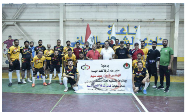
بطولة كأس شركة نفط الوسط