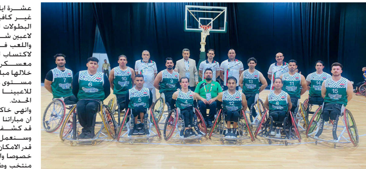
منتخبنا الوطني بالسلة على الكراسي