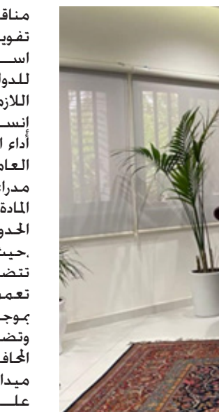
خلال لقاء لجان الامر الديواني للربط السككي والمدن الصناعية مع محافظ البصرة

مناقشتها هي آلية تنفيذ خطة ترويج الحجاج لعام 2023 من خلال استنفار جميع الملاكات البشرية للدوائر العاملة وتهيئة المتطلبات اللازمة لخدمة الحجاج وضمان إنسيابية مغادرتهم وآلية تقييم أداء العاملين من كافة الدوائر العاملة في المنافذ الحدودية من قبل مدراء المنافذ وحسب ما نصت عليه المادة 9 /ثالثاً من قانون هيئة المنافذ الحدودية المرقم 30 لسنة 2016. حيث تم الاتفاق على إعداد إستمارة تتضمن ضوابط ومعايير التقييم تعتم على مديريات المنافذ للعمل بموجبها. وتضمن الاجتماع أيضاً دعوة مثلي المحافظات في المجلس للقيام بزيارات ميدانية للمنافذ الحدودية للإطلاع على واقع حال المنافذ وتقييم الاحتياجات الفعلية وتبليتها من خلال قيام المحافظات بأعمار المنافذ من الإيرادات المتحققة.