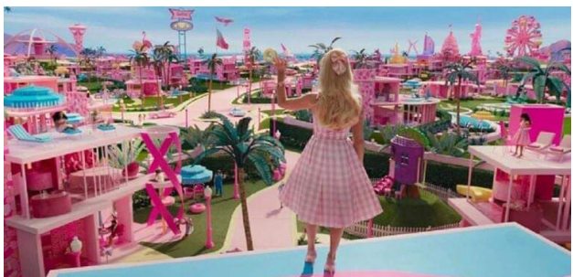
المشع الخاص بشركة Rosco". مصممة الإنتاج كيتي سينسر. بدورها لفتت إلى أن اللون الوردي أصبح بشكل حرفي ظاهرة في العالم. وقالت: "كانت لدينا

خطات ملحمية عندما خدثنا مع الفنانين من أجل معرفة طريقة خلط الألوان للوصول إلى اللون الصحيح". يذكر أن الأدوار الرئيسية في فيلم باربي أنه ماريو روبي وريان غوسلينغ. الفيلم يروي حكاية الدمية الشهيرة "باربي" وصديقتها كين وأصدقائهم في مدينة "باربي لاند" الخرافية. ووفق السيناريو. يتم طرد "باربي" من "باربي لاند" وهي الآن مضطرة لحوض مغامرات في العالم الحقيقي مع أشخاص حقيقيين ليبحث عن حياة جديدة. وسيتم أول عرض للفيلم في دور السينما في 21 يوليو 2023.