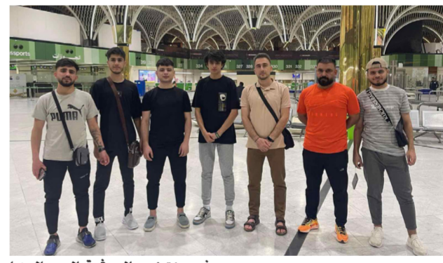
وفد منتخب الريشة إلى ماليزيا

تخلفت عن المعسكر لاسباب شخصيه بينما يشارك اللاعبون والتي يستقام في مصر في الأشهر المقبلة.