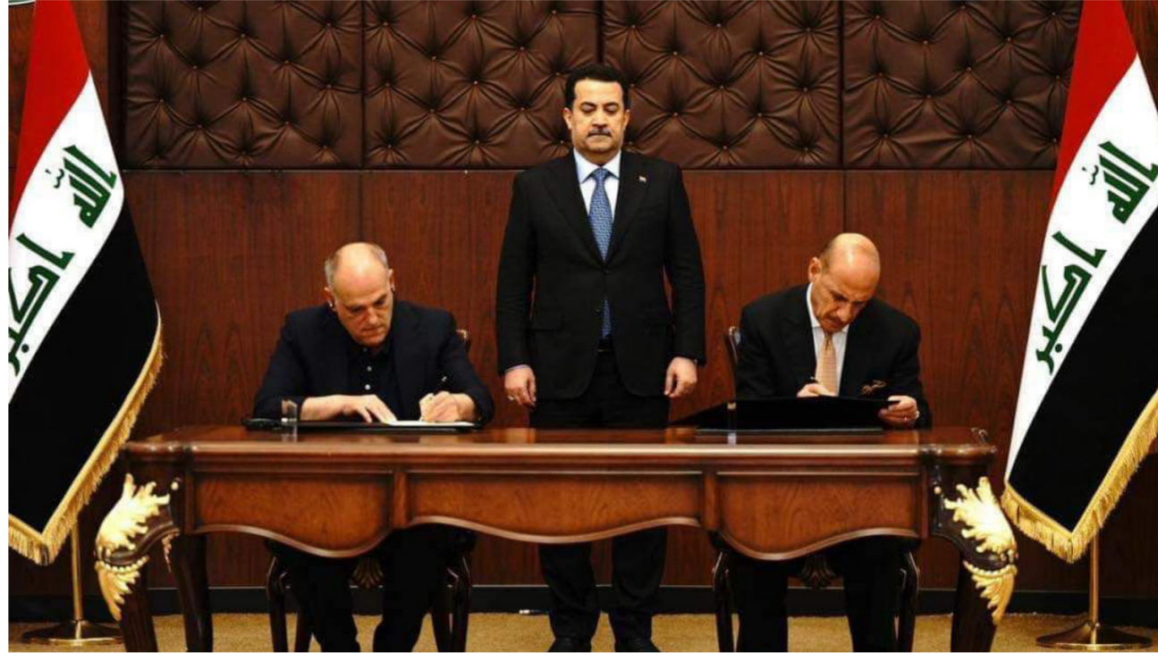
جانب من التوقيع

أكبر من مجرد كرة القدم، إنه نحو تعاون أوسع لتنشيط الرياضة في العراق. ويشمل عقد الشراكة عقدين، الأول المبرم بين اتحاد كرة القدم ورابطة الـ (لاليجا) والذي يخص الإدارة والإشراف على تنفيذ دوري المحترفين العراقي وتعيين مدير تنفيذي إسباني لإدارة المشروع، وكذلك إعداد فريق عمل عراقي، تقوم رابطة الـ دوري المحترفين بتدريبهم لإدارة اللجان العاملة على تنظيم مسابقة دوري المحترفين.