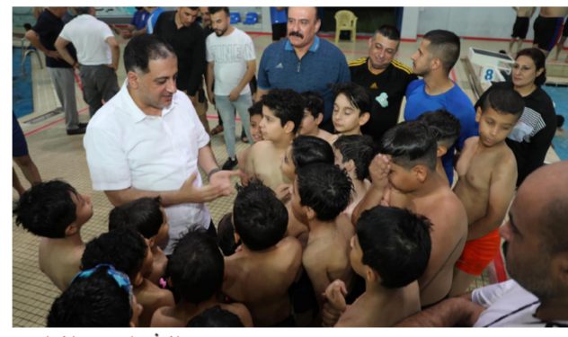
وزير الشباب بين المواهب

الخبرة الميدانية والإجازة، ولفت إلى سعي الوزارة لاستقطاب أصحاب الخبرات الفنية والكفاءات الأكاديمية من موظفيها للاستفادة من خبراتهم في تدريب وتأهيل الموهوبين بمختلف الألعاب والفعاليات، وإرسالهم في دورات تدريبية وتطويرية وورش تأهيلية في داخل البلد وخارجه، والوزارة ماضية في تهيئة احتياجات، ومتطلبات المركز الوطني لرعاية الموهبة الرياضية، ولا سيما خطوط النقل من وإلى المركز الوطني، وختم حديثه قائلاً: أن الوزارة تولي اهتماما كبيرا بموظفيها، وسعي