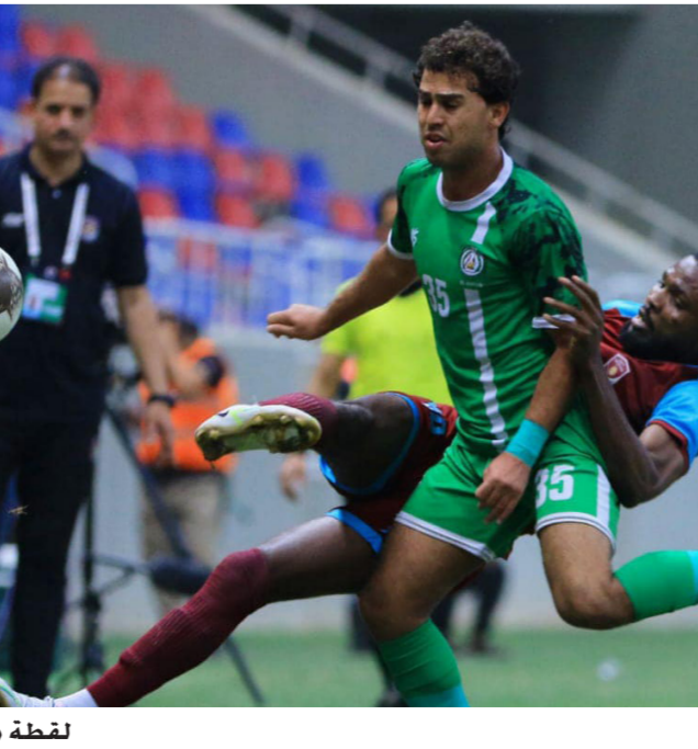
لقطة من دوري الكرة الممتاز