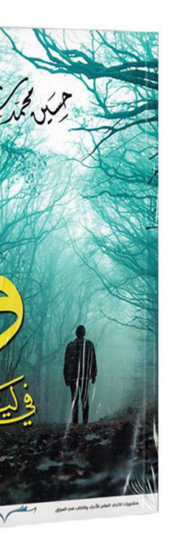
غلاف المجموعة القصصية

فالنص يكشف عما يعتبر المجتمع في تركيبته وتشكلاته من اختلالات ..وما يعترسه من أعطاب وأفات ينسجها المنتج(السارد) في قالب قصصي يعتمد أسلوبا يروم التلميح والإيحاء بدل الإقرار والتلميح..ألَمع استمفاته من كناية من مساحات للقراءة والتأويل .. بدل الاستخلاص والتحصيل عبر الإشارة والكلام..ألَمع استمفاته من كناية السرد وكثافته في توليفة أنتجت نصا غرائبيا بمقومات سردية متجانسة ومتكاملة ومتسائلة..وهي تزخر بلغة يومية تميل الى المجاز الذي لا يخلو من نفس شعري بما ينأى بها عن مغبة التقريرر والتصريح في تصوير مشاعر