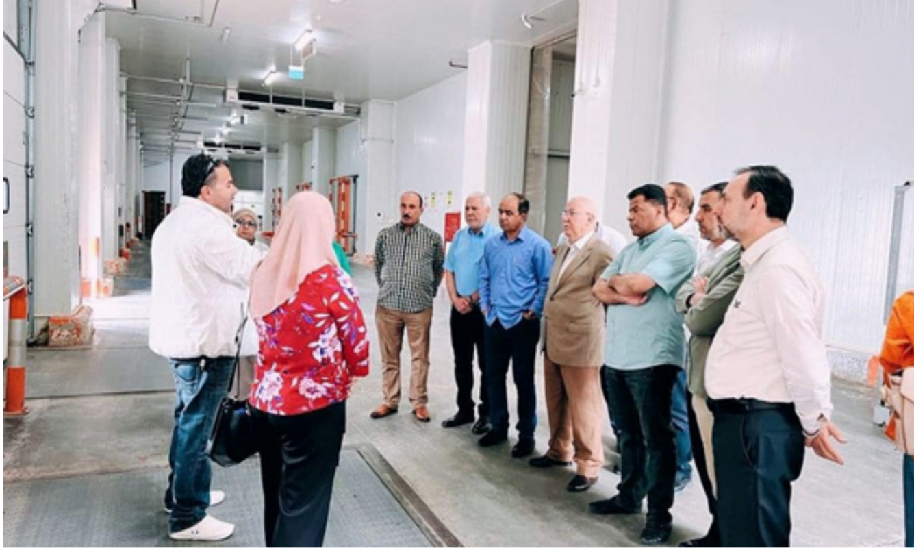
وفد زراعي من البصرة يزور المملكة الأردنية لتعزيز اواصر التعاون في المجالات الزراعية

جدا وبأسعار مناسبة وتكون مطابقة للصنف جينيا بحيث لا تختلف جينيا عن النبات الأم وهذه الصفات المرغوبة التي ينتجها مختبر زراعة الانسجة مضموناً وخالياً من الطفريات الوراثية أو التغييرات الجينية العنصل على أكثر العديدين من النباتات في المختبر حتى الوصول الى الحقل والإنتاج.