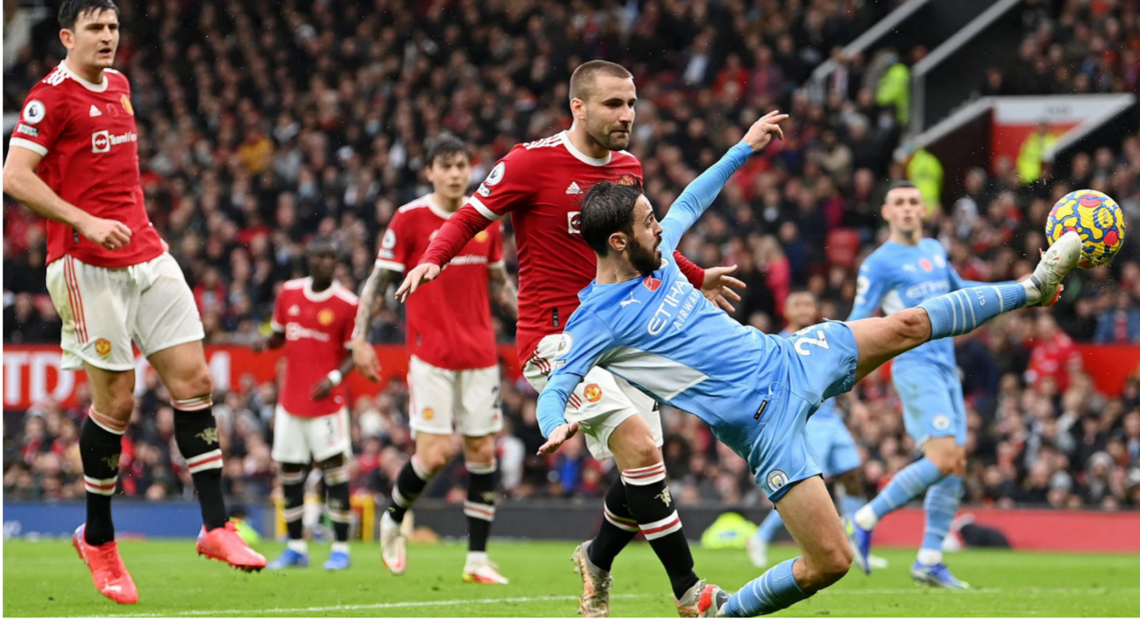
مانشستر يونايتد ومانشستر سيتي في مواجهة سابقة

وفي حديثه بعد حصوله على جائزة LMA، قال جوارديولا: «يسعدني تلقي جائزة أفضل مدرب في الدوري الإنجليزي لهذا العام، إنه لشرف لا يصدق أن أحصل على الجائزة. نحن في أفضل دوري في العالم وأعدكم بأننا سنكون هناك الموسم المقبل». وأشرف المدرب البالغ من العمر 52 عامًا على أكثر فترات مانشستر سيتي نجاحًا في تاريخ النادي، بفوزه بخمسة ألقاب في الدوري الإنجليزي الممتاز خلال فترة توليه المسؤولية.