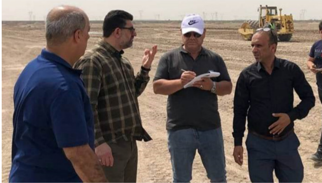
مدير عام النقل البري يزور ساحة حولي بغداد في اليوسفية

الحربي ومخلفات الكارتون والورق والأوراق التي تخللت الاجتماع بما يخص المدن الاقتصادية المشار إليها بالأمر الديواني لأجل رفع التوصيات إلى مجلس الوزراء . كما تم الإستماع لأهم المقترحات والآراء التي تخللت الاجتماع بما يخص المدن الاقتصادية المشار إليها بالأمر الديواني لأجل رفع التوصيات إلى مجلس الوزراء .