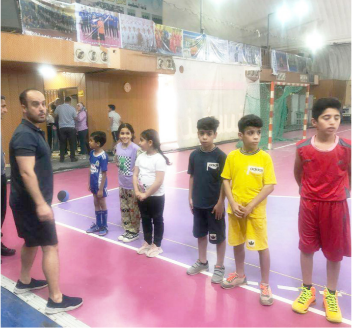
المواهب أثناء التدريبات