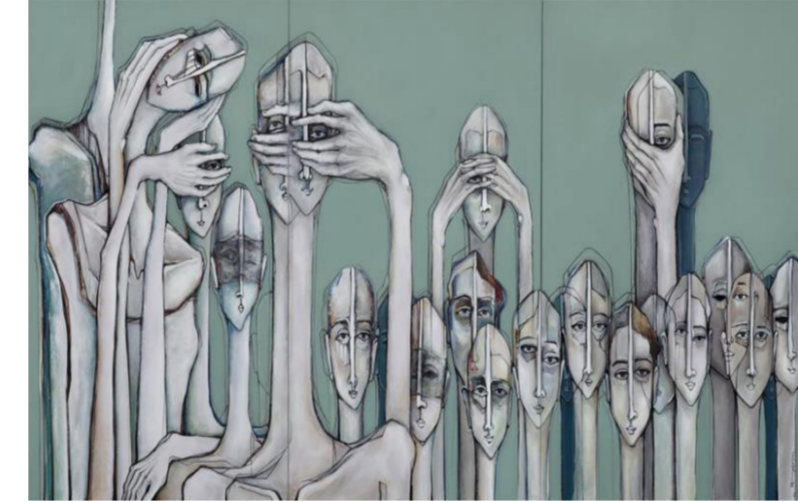
للرسم اللبناني الأرمني رايفي يدليان

يلغدو مثل غايات مهجورة. سوى الأيقاء على تراتيل الجيء قائمة بعلو هواجسها خت على توسلات الجيء المضحكة.صرخت العجوز التي فارقت اولادها دون سبب معقول... - كافيبيبي... فـما تلقىت سوى اجابات