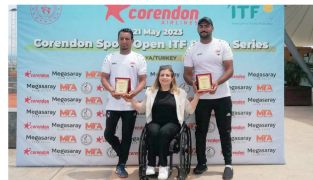
إبطال التنس البارالمبية

لاعبينا ترتيب أفضل في السجل الدولي للاعبين التنس على الكراسي وجاءت هذه النتائج الإيجابية من خلال التخطيط السليم لاجنادنا ومن خلفنا الاخوة في المكتب التنفيذي بقيادة رئيس اللجنة البارالمبية الدكتور عقيل حميد كما أن هذه النتائج قد وضعنا أمام مسؤولية كبيرة وعلينا أن نكون بحجم هذه المهمة والمسؤولية