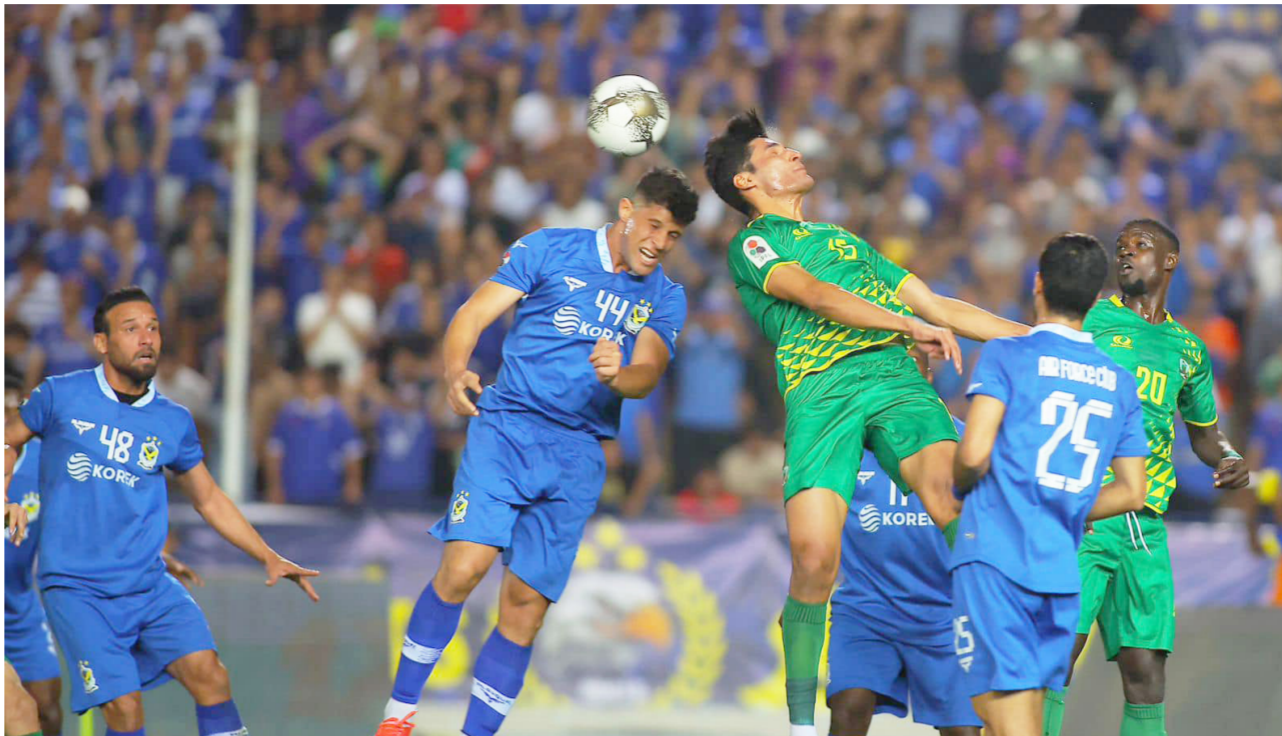
جانب من لقاء الجوية والشرطة في بطولة الكأس