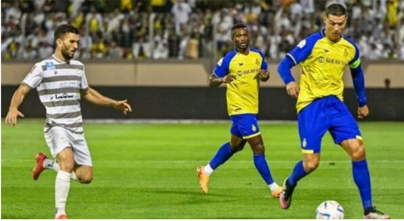
رونالدو ضد الطائي في دوري السعودية

من جانب اخر، فجر إعلان بعض الأندية، فوزها بالمشاركة في النسخة المقبلة بدوري أبطال آسيا، حالة من الجدل. برغم أن الاتحاد السعودي حدد في وقت سابق، أصحاب المقاعد في المسابقة القارية. وكانت لجنة التراخيص بإشراف دوري المحترفين السعودي، قد أعلنت أمس الإثنين، حصول 8 أندية على الرخصة الآسيوية. ما دفع بعض الأندية إلى إعلان فوزها بتفقد آسيوي. وحصلت السعودية واليابان في دوري أبطال آسيا، على 3 مقاعد مباشرة، بجانب مقعد ملحق.