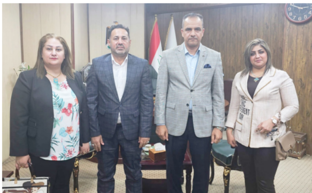
لقاء الأخاد العام للمهن الرياضية بنقابة الأكاديميين