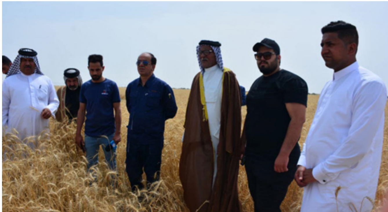
مدير زراعة البصرة يتابع عملية حصاد الحنطة في النشوة

المكاتب الزراعيه الموجودة ضمن قطاع عمل الشعبة لغرض توجيههم بعدم استخدام اليبيدات الحظيرة لما لها من تأثير بالغ على صحة الإنسان وما تسببه من تلوث بيئي خطير. وقامت شعبة زراعة ابي الحصبب متمثلة بوحدة وقاية المزروعات بتوزيع المصائد الفرمونية الخاصة بحشرة الحميرة التي تصيب اشجار النخيل على الفلاحين ضمن قطاع عمل الشعبة الوقاية بتوزيع المصائد الفرمونية لحشرة الحميرة على نخيل التمر ضمن قطاع عمل الشعبة الزراعية للقضاء على حشرة الحميرة دون استخدام اليبيدات الكيماوية علما ان المصائد توزع مجاناً.