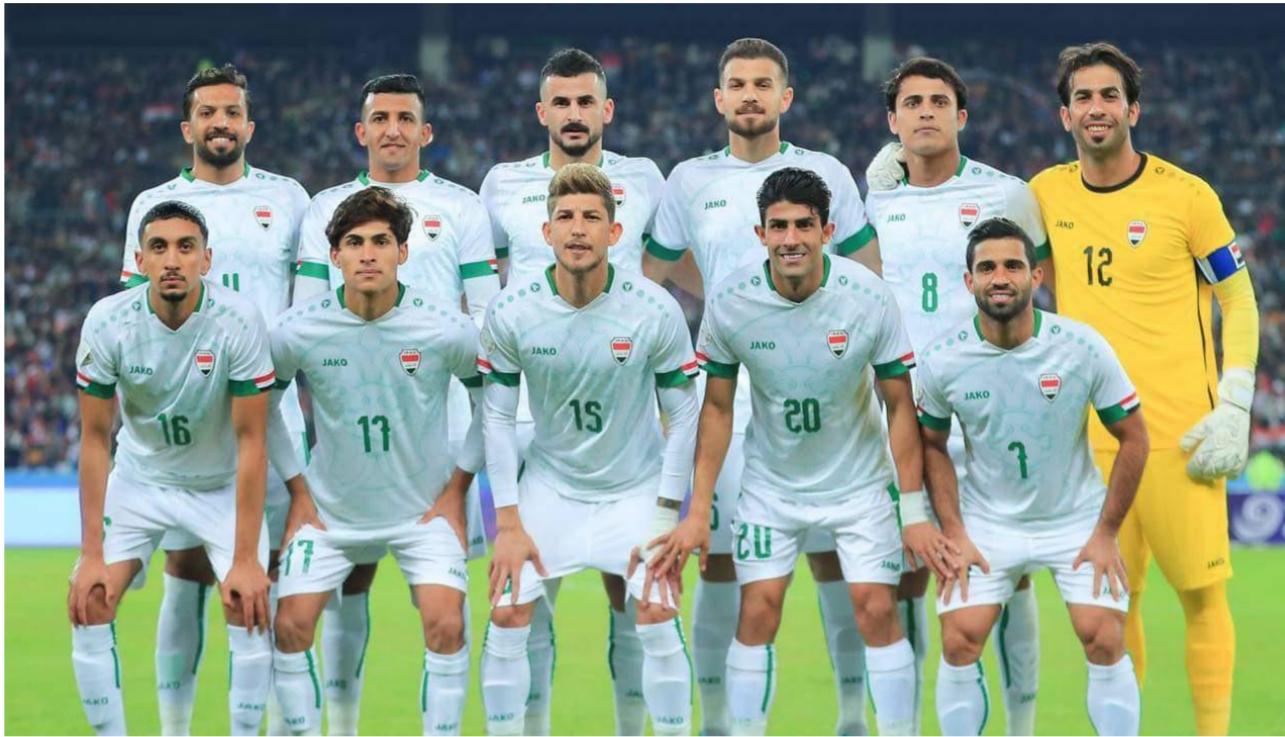
المنتخب الوطني لكرة القدم