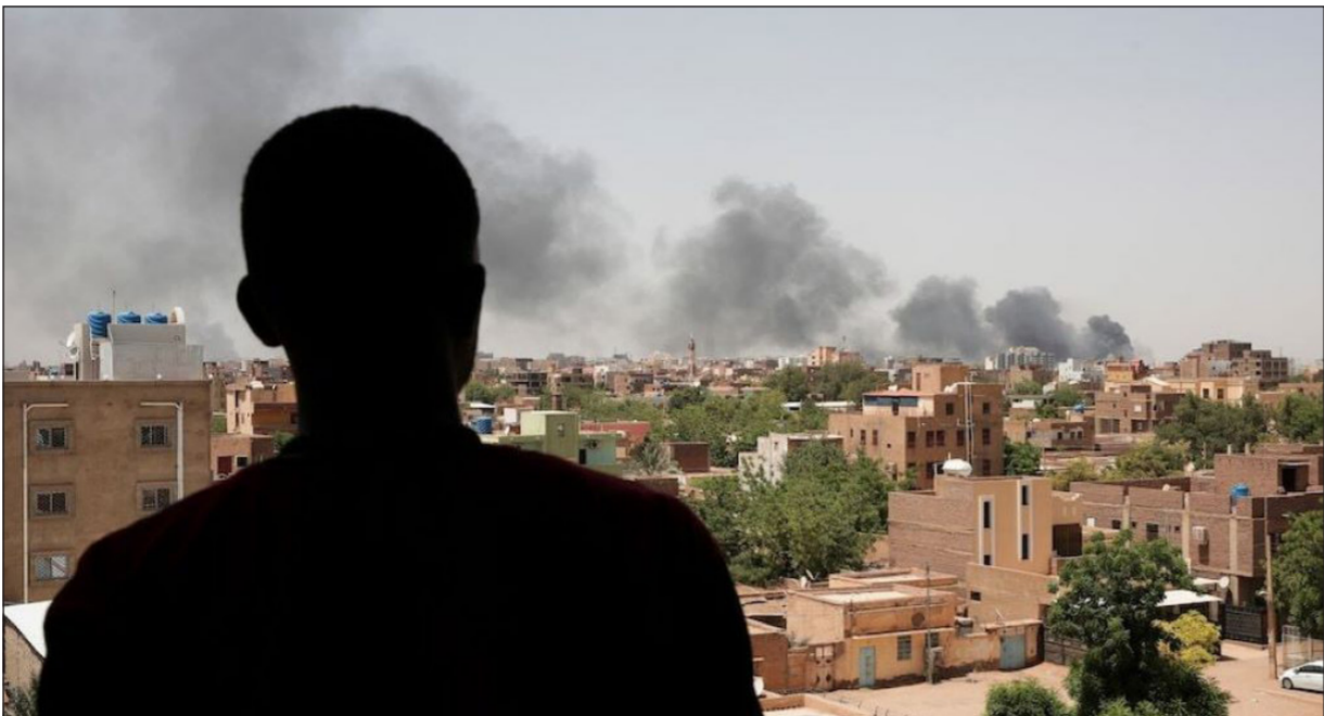
مؤلم أن ترى الأندية الثقافية التي كانت تعج بالحراك وهي قفر